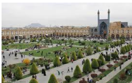
تصویر شماره ۱: میدان نقش جهان اصفهان؛ منبع: نگارندگان تصویر شماره ۲: سیتی سنتر اصفهان؛ منبع: نگارندگان