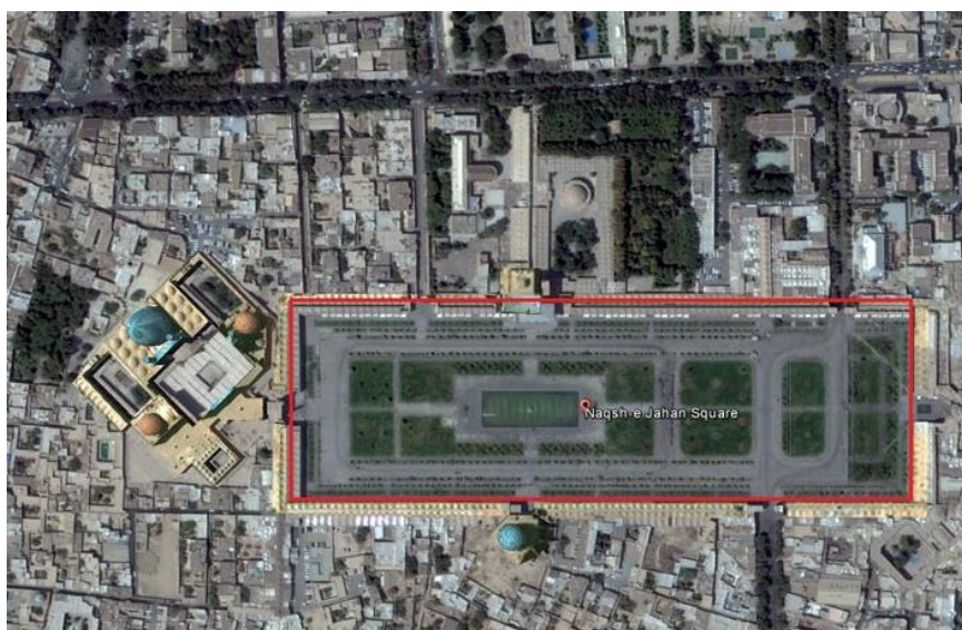
نقشه شماره ۲: موقعیت میدان نقش جهان اصفهان؛ منبع: نگارندگان

به لحاظ استقرار کاخ سلطنتی، عملکرد مذهبی به لحاظ استقرار دو مسجد، عملکرد تجاری به لحاظ وجود حجره‌ها و قرارگیری در بطن بازار و عملکرد تفریحی بدلیل برگزاری جشنها و اعیاد ملی اشاره نمود.