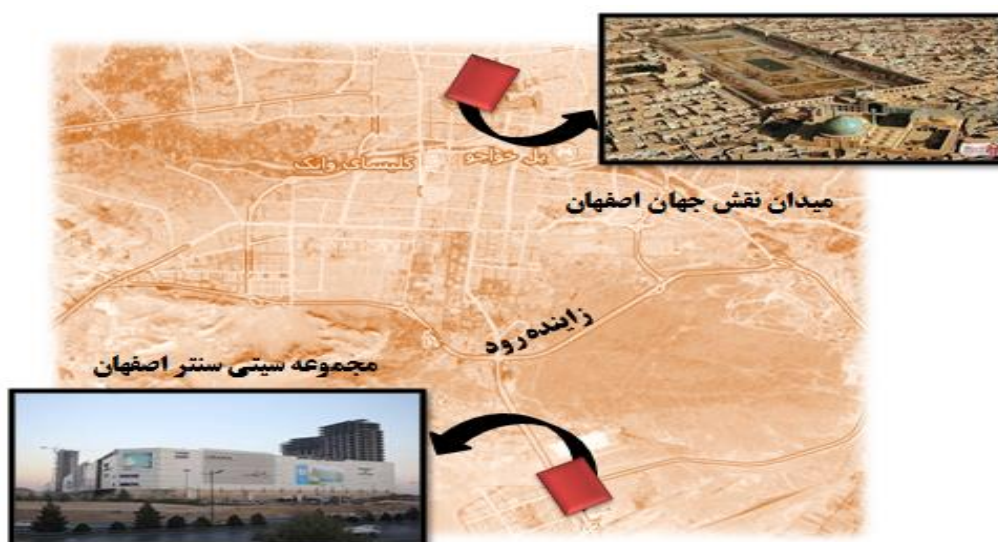
نقشه شماره ۱: موقعیت دو نمونه مورد مطالعه میدان نقش جهان و مجموعه سیتی سنتر اصفهان؛ منبع: نگارندگان

امام در جنوب میدان، مسجد شیخ لطف الله در شرق، کاخ عالی قاپو در غرب و سر در قیصریه در شمال قرار دارند که هر یک در نوع خود شاهکاری بی بدیل می‌باشند. این میدان در طول حیات خود کاربری‌های متنوعی را بر عهده داشته که از جمله می‌توان به عملکرد سیاسی