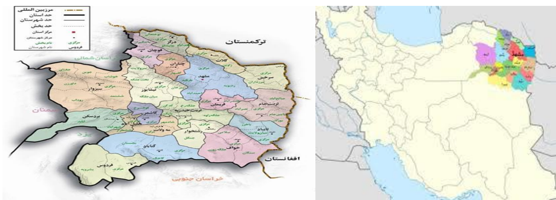
منبع سایت گردشگری استان خراسان رضوی

استان خراسان رضوی از نظر موقعیت جغرافیایی به دویبخش شمالی و جنوبی تقسیم شده است که نواحی شمالی آن دارای دشت‌های حاصلخیز کشاورزی و دامپروری است و بخش جنوبی آن از دشت‌های کویری با تپه‌های کم ارتفاع با پوشش گیاهی فقیرتشکیل شده است. در این منطقه، چند رشته کوه وجود دارد که دو رشته کوه هزار مسجد و بینالود از دیگر کوه‌ها مرتفع و پرامتداد است. آب و هوای این استان در ناحیه معتدل شمالی قرار گرفته و به طور کلی م تغییر است و دمای هوا از شمال به جنوب افزایش می‌یابد ولی از بارش سالانه کاسته می‌شود. استان خراسان رضوی در مناطق مختلف دارای شرایط اقلیمی متنوعی است به طوری که مناطق کوه پایه ای دارای آب و هوای نیمه بیابانی ملایم، نواحی جنوبی « گرم و خشک » و مناطقی چون قوچان، نواحی جنوب بینالود، ارتفاعات هزار مسجد و قسمتی از شهرستان مشهد دارای آب و هوای معتدل کوهستانی است.