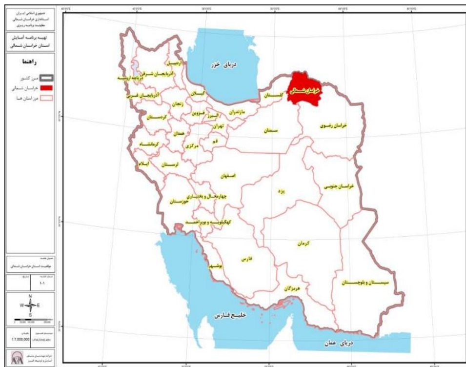
نقشه ۱- موقعیت استان خراسان شمالی

استان خراسان شمالی با مساحتی حدود ۲۸۱۷۹ کیلومتر مربع از ۸ شهرستان بجنورد (مرکز استان)، شیروان، اسفراین، مانه و سملقان، راز و جرگلان، جاجرم، فاروج و گرمه تشکیل شده‌است. این استان از نظر موقعیت جغرافیایی؛ از شمال با کشور ترکمنستان، از شرق و جنوب با استان خراسان رضوی، از جنوب غربی با استان سمنان و از غرب با استان گلستان هم‌مرز است.