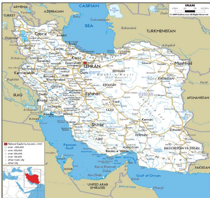
نقشه ۱: مهم‌ترین کانون‌های شهری ایران

رفع مسائل یاد شده، توسعه‌ی رشته‌های جدیدی مانند برنامه‌ریزی شهری و شهرسازی، و ایجاد یک مدیریت کارآمد در شهرها مورد توجه قرار گرفته است.