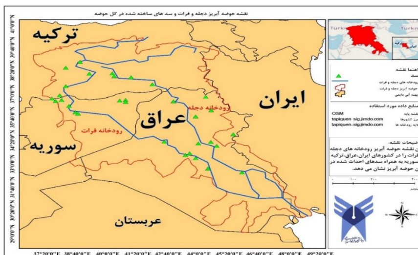
نقشه ۲: موقعیت حوضه آبریز دجله و فرات و سد های ساخته شده در کل حوضه

۱. مسائل مربوط به سدسازی ۲. تعیین سهم حقا به هر کشور ۳. موضوع تالاب‌ها و باتلاق‌ها ۴. مساله آلودگی آب‌ها و مسائل زیست‌محیطی دیگر مانند ریزگردها و بیابان زدایی ۵. موضوع لایروبی اروندرود ۶. مساله آب‌خیزداری در حوضه اعم از بالادست و پایین دست ۷. استفاده از تجربه مدیریت یکپارچه سایر حوضه‌های رودخانه‌ای (عراقچی، ۱۳۹۴: ۱۳۳) اروندرود نیز که برای هر دو کشور ایران و عراق ارزش نظامی و اقتصادی دارد، همواره مورد مناقشه بوده و به رغم توافقات ۱۹۷۵ الجزایر، اختلافات بر سر مرزهای آبی اروندرود هنوز می‌تواند منازعه انگیز باشد. ( عبدالملکی و همکاران، ۱۳۹۸: ۷۸۴-۷۸۳)