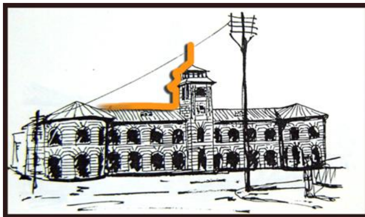
شکل ۳- ساختمان شهرداری با فرم اولیه برج آن

نمادین یافته است و موجب توقف دید و جلب توجه می‌شود. این عنصر کالبدی در حافظه تاریخی و جمعی شهر جای گرفته و هویت منحصر به فردی در میدان ایجاد می‌کند (شکل ۳).