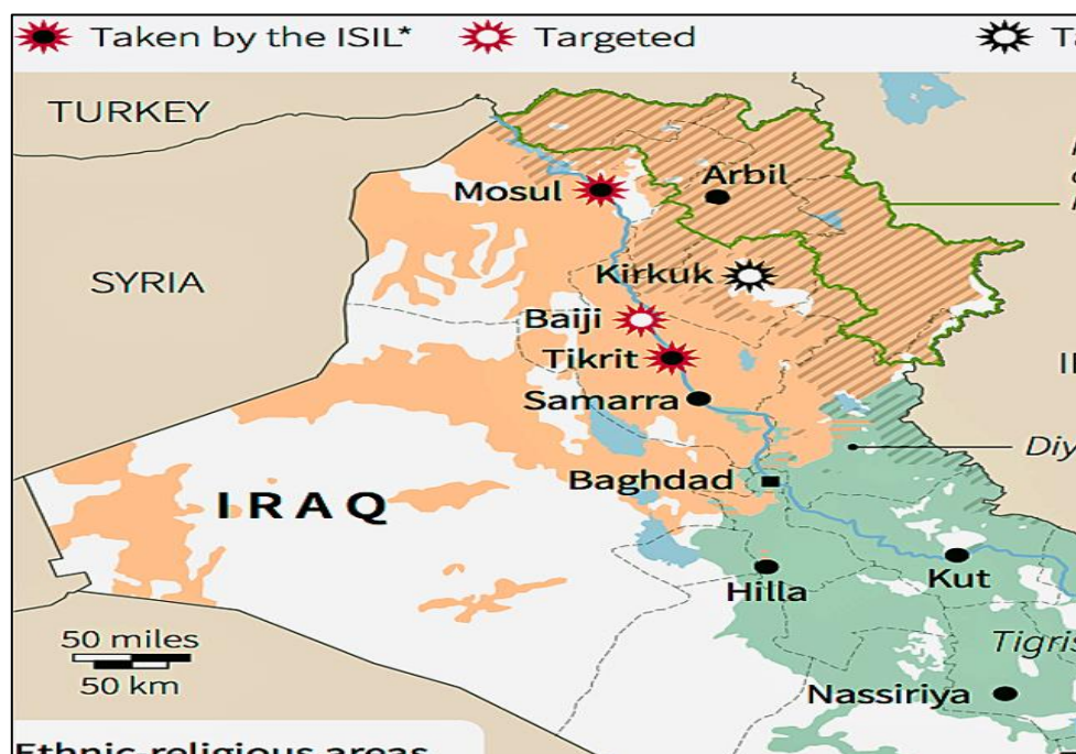
نقشه ۱- موقعیت مناطق کردنشین عراق

سازمان جغرافیایی نیروهای مسلح و بر اساس حریم جزر و مد، نوار ساحلی عراق بین ۲۰ تا ۴۸ کیلومتر برآورد می‌شود (بهمن، ۱۳۹۲).