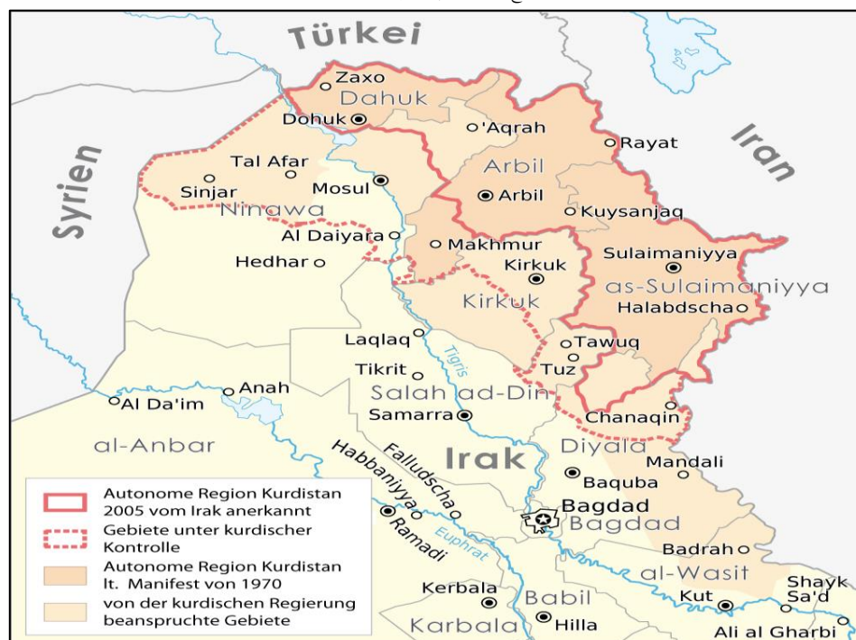
نقشه ۳- استان‌های وابسته به کردستان عراق

شمال عراق از نظر بحث قومیت هرچند منطقه‌ای دارای با تنوع اقوام می‌باشد ولی اکثریت منطقه در اختیار سه قوم کردها، ترکمن‌ها و اعراب هست.