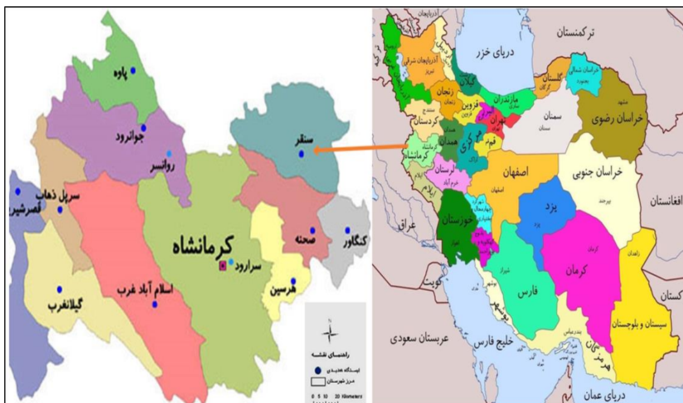
نقشه ۱- استان کرمانشاه

استان کرمانشاه در غرب ایران، با مساحتی حدود ۲۴ هزار و ۴۳۴ کیلومتر مربع واقع شده‌است. این استان از شمال به استان کردستان، از جنوب به استان‌های لرستان و ایلام، از شرق به استان همدان و از غرب به کشور عراق محدود می‌شود. مرکز استان کرمانشاه، شهر کرمانشاه است و شهرهای مهم این استان عبارتند از: اسلام آباد غرب، پاوه، جوانرود، سرپل ذهاب، سنقر، صحنه، قصر شیرین، کنگاور، گیلان غرب، هریس (میره ای و همکاران، ۱۳۹۵).