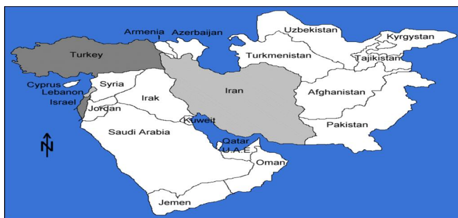
نقشه ۳: کشورهای واقع در منطقه خاورمیانه و سواحل دریای عمان

منطقه ژئوپلیتیکی جنوب غرب آسیا یا همان خاورمیانه به واسطه برخی دلایل و زمینه‌های ژئوپلیتیکی موجود در دهه‌های اخیر آستان رقابت و درگیری‌های فراوانی بوده است؛ مجموعه حوادثی که این منطقه از جهان را به یکی از ناامن‌ترین مناطق تبدیل کرده است و جنگ و خون‌ریزی بخش جدایی‌ناپذیر آن شده است. حضور رژیم صهیونیستی