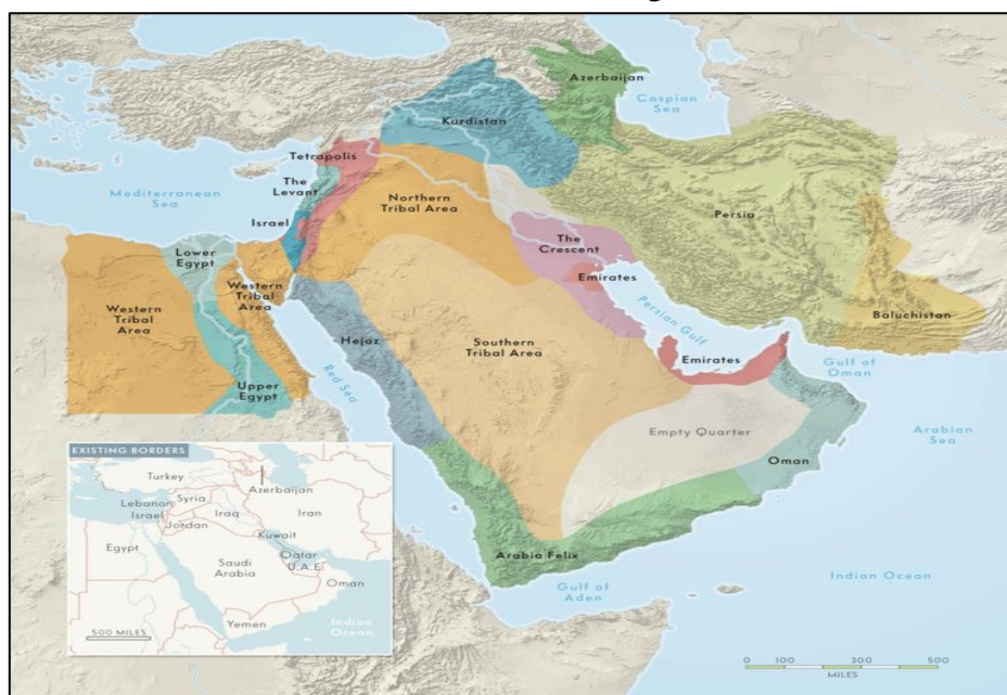
نقشه ۵: مرزهای منطقه خاورمیانه و سواحل دریای عمان