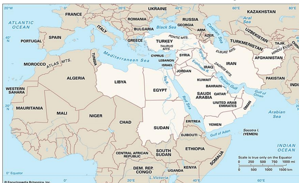
نقشه ۴: محیط پیرامونی خاورمیانه

سعودی به بهانه‌های واہی به طور بی‌سابقه‌ای تلاش می‌کند تا محور سنی را علیه ایران رهبری کند. عربستان سعودی که از دیرباز طرفدار حمایت مالی از مخالفان دولت سوریه و مبارزه علیه محور شیعه بوده است، اکنون به مداخله نظامی مستقیم نیز مبادرت کرده است. این مداخلات نظامی از بحرین شروع شد و اکنون در یمن به اوج رسیده است که در آنجا عربستان سعودی عمدتاً از طریق حملات هوایی جنگ علیه انقلابیون را ادامه می‌دهد. این تحرکات جدید سعودی که در بسیاری از مناطق جریان دارد، نه فقط گروه‌ها و کشورهای منطقه‌ای را درگیر اقدامات جنگ افروزانه خود کرده است، بلکه پای بسیاری از قدرت‌های غربی را نیز به منطقه باز کرده است، همچنان که سفر اخیر ترزا می به منطقه را می‌توان در راستای ایران هراسی و حمایت از اقدامات سعودی تحلیل کرد (محمدی، ۱۳۸۷).