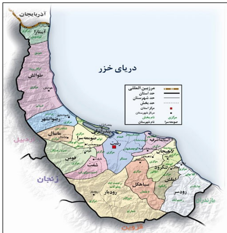
شکل ۱) موقعیت جغرافیایی و تقسیمات شهری استان گیلان. (منبع: سازمان میراث فرهنگی، صنایع دستی و گردشگری گیلان).