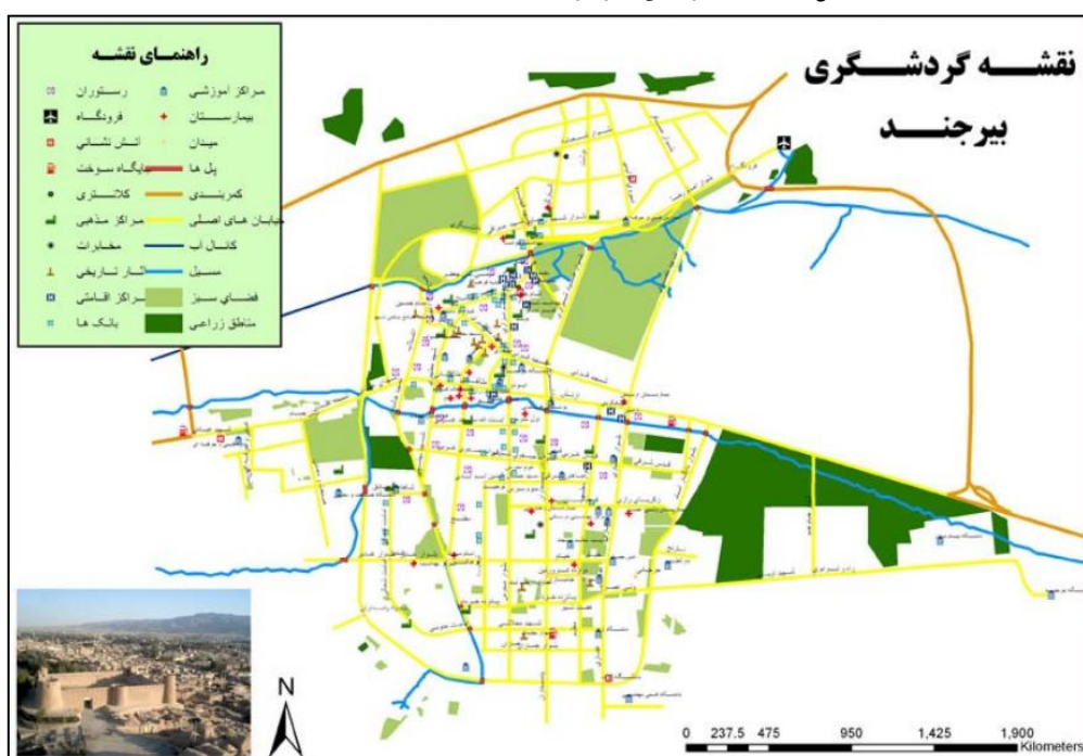
شکل ۲ موقعیت جغرافیایی شهر بیرجند http://www.shora-birjand.ir