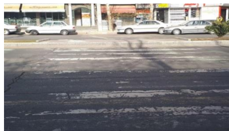
شکل ۷. وضعیت نامناسب خط کشی عابر پیاده، مقابل کوچه بختیاری

در شکل شماره ۷ وضعیت نامناسب خط کشی عابر پیاده رو و وجود جزیره و اختلاف سطح در وسط بلوار امام خمینی نشان داده شده است.