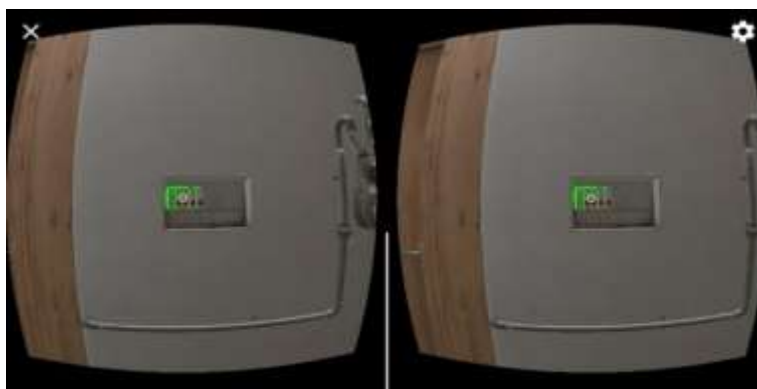
شکل ۳. قطع جریان برق به وسیله کاربر (منبع: نویسندگان، ۱۴۰۰)

هنگامی که زلزله متوقف می‌شود کاربر کوله پشتی که شامل لوازم ضروری می‌باشد را برداشته و از فضای داخلی به سمت محیط بیرون می‌رود و در این محیط جریان برق و گاز را قطع و از خانه خارج می‌شود. (شکل ۳) نحوه قطع جریان برق به وسیله کاربر را نشان می‌دهد.