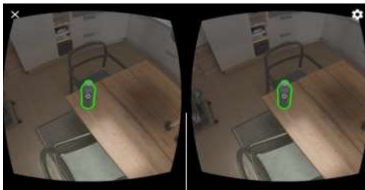
شکل ۱. جمع‌آوری لوازم ضروری به وسیله کاربر

محیط مجازی در این تکنیک، محیط یک خانه است که هم به صورت فضای داخلی و هم به صورت فضای خارجی طراحی شده است. در فضای داخلی چهار اتاق طراحی شده که در داخل آنها چندین شیء قرار دارد، فضای خارجی شامل یک حیاط می‌باشد. واقعیت مجازی علاوه بر امکان ارتباط با وسایل مجازی، این امکان را به کاربر می‌دهد که بتواند، با استفاده از کنترلر، در محیط مجازی راه برود و در آن جست و جو کند. کاربر می‌تواند برنامه واقعیت مجازی و تعاملات آن را با کنترلی که با بلوتوث به برنامه متصل است، انجام دهد. پس کاربر نیازی به راه رفتن در هنگام استفاده از برنامه ندارد و می‌تواند به صورت نشسته یا ایستاده تمرینات خود را انجام بدهد. مراحل انجام تکنیک شامل دو بخش می‌باشد. در بخش اول که مربوط به اقدامات قبل از وقوع زلزله است به کاربر آموزش داده می‌شود که لوازم ضروری مانند، جعبه کمک‌های اولیه، بیلچه، لوازم بهداشتی فردی، چراغ قوه، رادیو، بطری آب و ... را از فضای داخلی محیط جمع‌آوری و در داخل کوله‌پشتی قرار دهد. (شکل ۱) نحوه جمع‌آوری لوازم ضروری به وسیله کاربر را نشان می‌دهد.