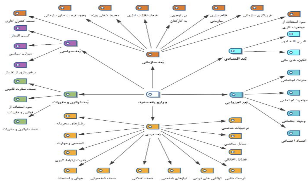
شکل ۱- شبکه مقولات و مفاهیم مربوط به مولفه‌های جرایم یقه سفیدی

باتوجه به مولفه‌های استخراج شده در مرحله کدگذاری محوری، کلیه مقوله‌ها ترکیب شدند. این مقوله‌ها در مرحله بعد برای ساخت شبکه مقولات و مفاهیم مورد استفاده قرار می‌گیرند. تصویر کلی مربوط به شبکه مقولات هر کدام از متغیرهای مقاله به شرح زیر می‌باشد.