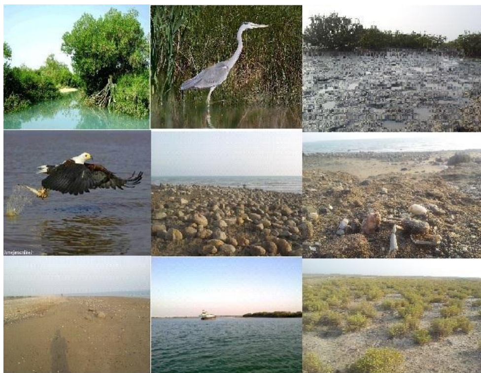
شکل (۲): نمایشی از تالابها منطقه مورد مطالعه