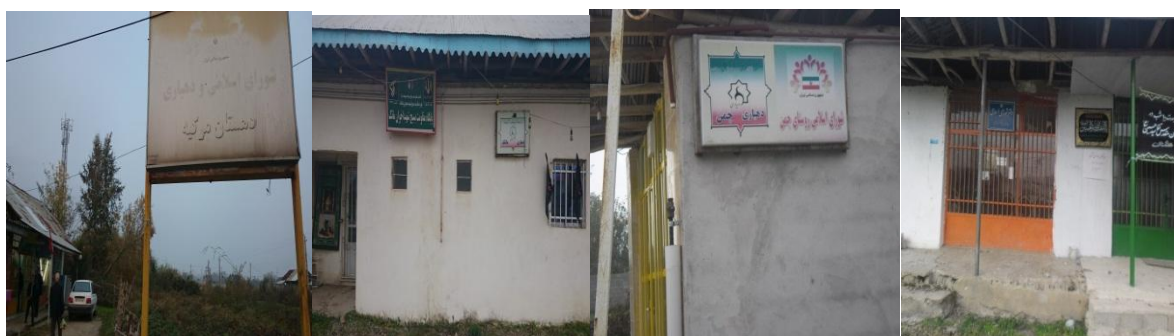
عکس تصاویر برخی از دهیارها و شوراهای اسلامی در روستاهای شهرستان صومعه سرا

مدیریت روستایی در ایران از اوایل شکل‌گیری به گونه‌های متفاوتی نمود یافته و فرازو نشیب‌های فراوانی را به لحاظ تشکیلات و زیربنای قانونی داشته است. پس از استقرار نظام جمهوری اسلامی، با تصویب قانون تشکیلات شوراهای اسلامی کشوری (مصوب ۱۳۶۱) نهاد مدیریتی جدیدی تحت عنوان شورای اسلامی روستا به عنوان متولی مدیریت روستایی معرفی شد. ولی از آنجا که در این قانون هیچ گونه نقش اجرایی برای شورا تعریف نشده بود، این نهاد هیچ گاه نتوانست جایگاه واقعی خود را در مدیریت روستایی بیابد و خلاء مدیریتی روستاها را پر کند. بالاخره در سال ۱۳۷۵ با تصویب قانون شوراها و همچنین قانون دهیاریهای خودکفا در روستاهای کشور (مصوب ۱۳۷۷) مدیریت روستایی بر عهده شورا و دهیاری گذاشته شد. بدین ترتیب که شورا به عنوان نهاد تصمیم گیر، برنامه ریز و سیاستگذار و دهیاری نیز به عنوان بازویی اجرایی شورا و مسئول اجرایی مدیریت روستا پایه عرصه مدیریت روستایی کشور گذاشت و تجربه جدیدی در عرصه مدیریت روستایی شکل گرفت. شهرستان صومعه سرا دارای یکصد و پنجاه آبادی دارای سکنه و یک آبادی خالی از سکنه بوده که در اکثر این آبادی‌ها دهیار یا شورای روستا مدیریت می‌کنند. هریک از دهیاران با توجه به وظایف محول شده توسط مراجع بالاتر در کشور زیر نظر بخشداری و فرمانداری شهرستان در روستاها خدمت می‌نمایند. تصاویر زیر برخی از دهیارها و شوراهای نه چندان مناسب در این شهرستان می‌باشد.