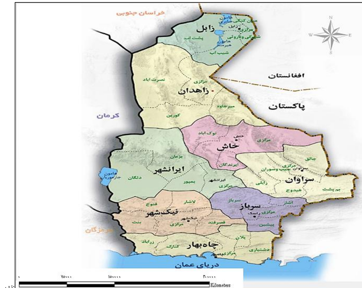
شماره ۲- تقسیمات سیاسی استان سیستان و بلوچستان

از سال در این ناحیه اثری از باران مشاهده نمی‌شود. میزان بارندگی از طرف شرق به غرب استان افزایش می‌یابد. متوسط سالیانه بارندگی آن حدود هفتاد میلی‌متر و بسیار نامنظم است.