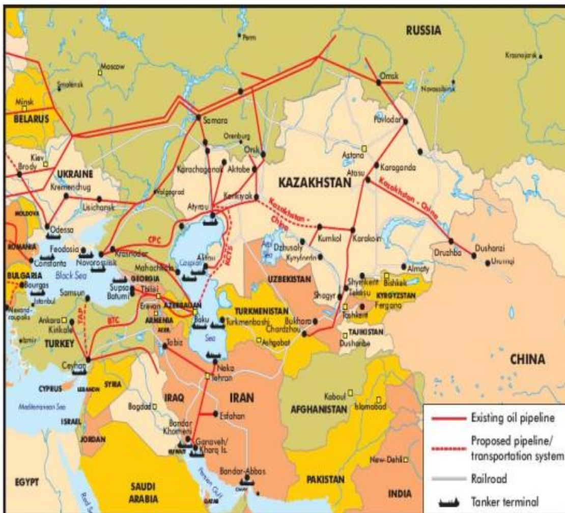
نقشه ۱- موقعیت ایران در هارتلند انرژی جهان

مجاورت جغرافیایی این کشورها با منطقه خلیج فارس، باعث شده است تا این کشورها برای تأمین نیازهای روزافزون انرژی خود به ذخایر عظیم گاز خلیج فارس توجه کنند. از طرفی دیگر، چالش‌های ژئوپولیتیکی روسیه (به‌عنوان تأمین‌کننده انرژی گاز اروپا) با اروپا و قطع خطوط لوله گاز در زمستان‌های طاقت فرسای اروپای شمالی در کشور اوکراین از جانب روسیه و بی‌ثباتی بازار نفت، باعث شده کشورهای اتحادیه اروپا نیز به ذخایر گاز خلیج فارس توجه کنند، و مشتریان بالقوه و بالفعل گاز خلیج فارس شناخته شوند.