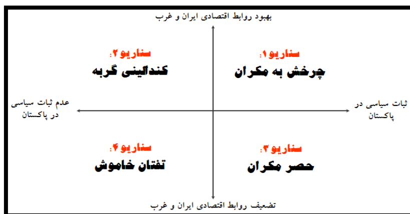
نمودار ۲- ماتریس سناریوهای وضعیت ژئوپلیتیکی مکران