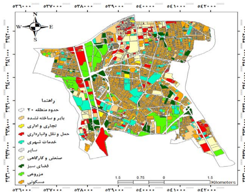
شکل شماره ۲- نقشه کاربری منطقه ۲۰