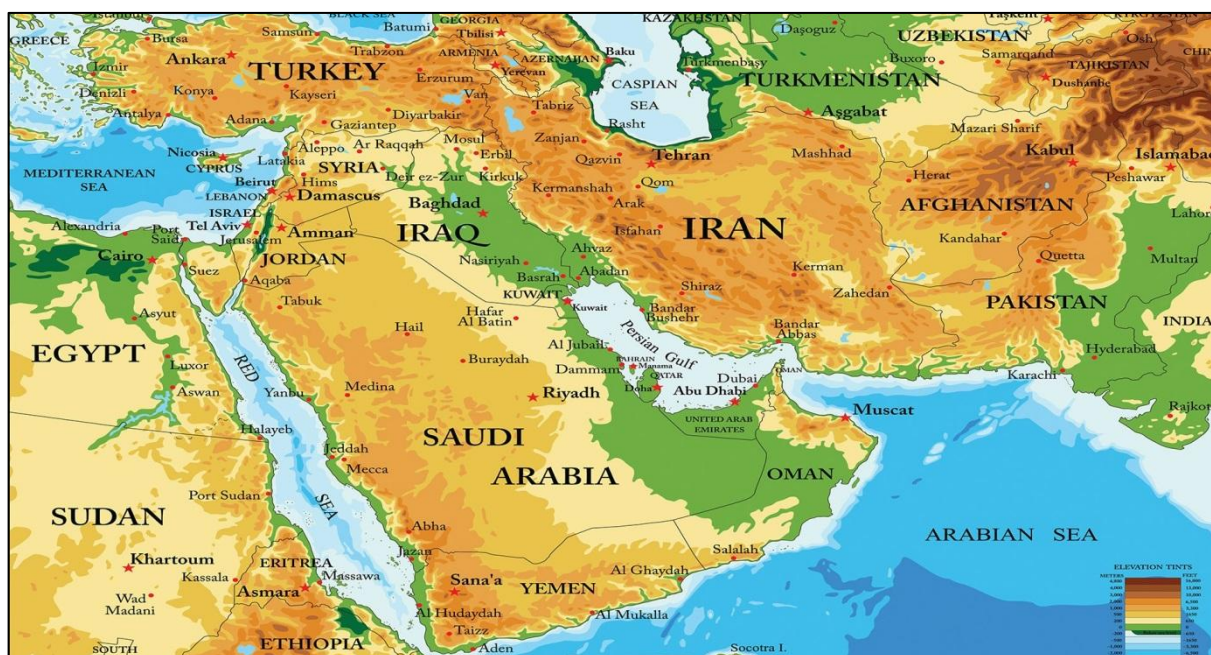
نقشه ۲: حوزه جغرافیایی خاورمیانه