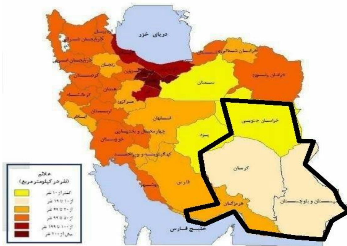
نقشه شماره ۱- پراکنندگی جمعیت در ایران به تفکیک استانها (مرکز آمار ایران، ۱۳۹۵)

از جمله موارد دیگر دلایل انتخاب این منطقه وسعت زیاد و جمعیت بسیار کم نسبت به استانهای دیگر است و از ویژگی‌های مناطق رو به رشد اهمیت به توسعه شهری پایدار است. (خمر، ۱۳۱۳۹۴: ۲۲۸) (نقشه شماره ۱ و جدول شماره ۱)