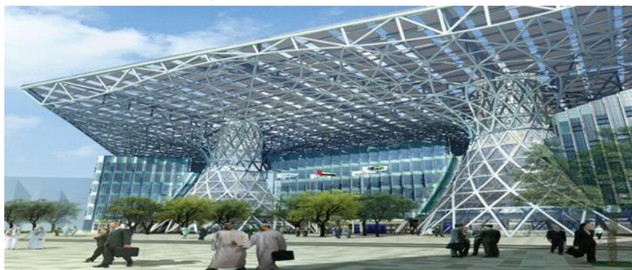
تصویر شماره ۱. مصدر سیتی در امارات نمونه‌ای از شهرهای هوشمند پایدار در آینده. (منبع: سایت مصدر)

در حالی که افزایش علاقه به توسعه پایدار از یک درک از فشاری که بشریت در اکوسیستم‌های جهانی تحمیل می‌کند ناشی می‌شود و شهرنشینی نتیجه حرکت مردم به سمت شهرها است توسعه و پیشرفت ICT به عنوان توسعه فنی پذیرفته می‌شود. برای رسیدن به شهر هوشمند پایدار فناوری اطلاعاتی و ارتباطات رکن اصلی این ساز و کار است. به نظر می‌رسد با توسعه فناوری اطلاعاتی و ارتباطی بسیاری از مسافرت‌ها انجام نمی‌شود و هزینه‌های تولید و مصرف انرژی نیز کاهش پیدا می‌کند. حتی می‌تواند منجر به تولید محصولات ارزان‌تر و رونق بازارها شود. با وجود این فرصت‌ها برای به روز رسانی و جایگزینی با تجهیزات مخابراتی و ارتباطی باید تلاش کرد از جمله تلفن و دسترسی به اینترنت و سیستم‌های بی سیم (wireless). در کشور ایران ضریب نفوذ اینترنت در سالیان اخیر بهبود پیدا کرده اما نسبت به کشورهای منطقه کیفیت آن پایین بوده و باید اصلاح شود.