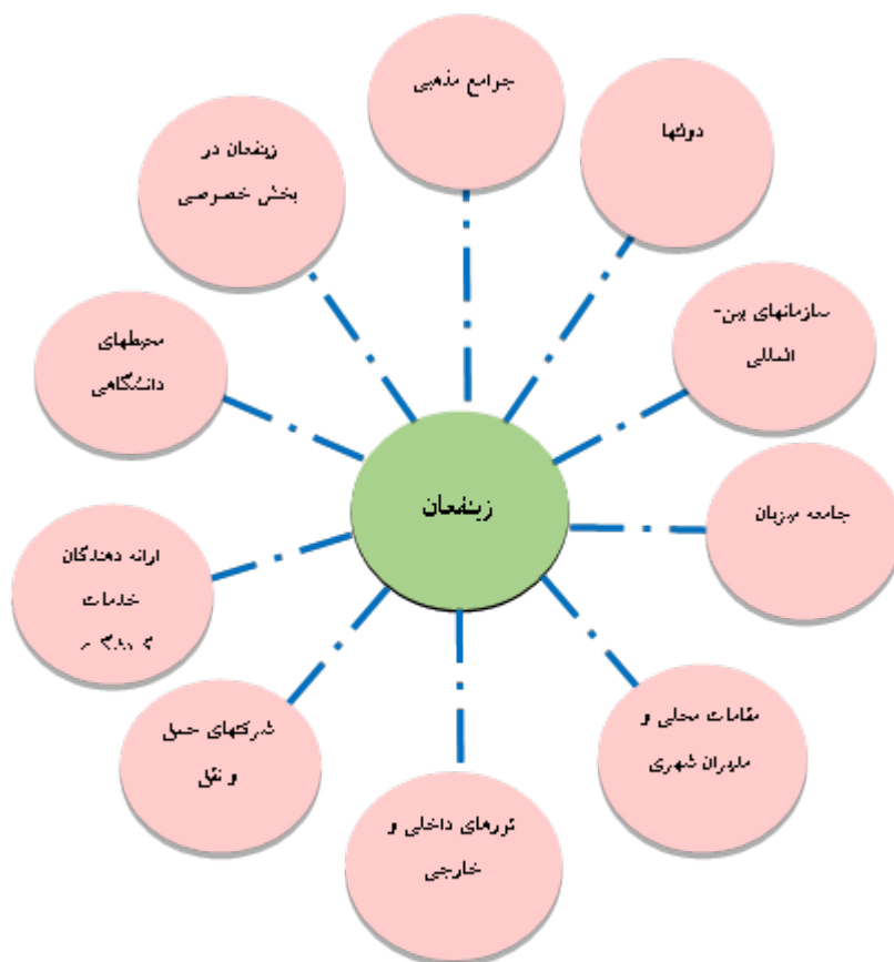
شکل ۱: زیلفغان گردشگری مذهبی

ساکن هستند از منافع اقتصادی زیادی بهره‌مند می‌شوند. بنابراین حکومت‌ها به دنبال توسعه امکانات برای جذب گردشگران هستند تا بدینوسیله بخشی از منافع اقتصادی خود را تأمین کنند. بر اساس برآورد سازمان جهانی گردشگری، گردشگری مذهبی ۲۶ درصد از کل جریان‌های گردشگری جهان را به خود اختصاص داده است. در این نوع از گردشگری انگیزه اصلی زیارت اماکن مقدسه و زیارتگاه‌هاست (ابراهیم‌زاده و همکاران، ۱۳۹۲: ۱۱۵-۱۴۱). از نمونه سفرهای مذهبی می‌توان به روز جهانی جوان اشاره کرد که به ابتکار واتیکان برای قوی‌تر کردن باورهای دینی در بین جوانان کاتولیک به صورت جهانی برگزار می‌شود. این سفر، یکی از بزرگ‌ترین آیین‌های مذهبی برای جوانان دنیا است و به عنوان نمونه در سال ۲۰۰۵ که در آلمان برگزار شد، بیش از ۴۳۵ هزار زائر از ۱۹۷ کشور در این مراسم مذهبی شرکت کردند. در اسلام نیز، آیین حج به عنوان یکی از بزرگ‌ترین مراسم مذهبی جهان سالانه بیش از ۲ میلیون زائر را در شهر مکه گردهم می‌آورد. پیش بینی می‌شود که گردشگری مذهبی عربستان سعودی در دهه آینده، هر ساله از رشدی ۲۰ درصدی بهره‌برد و تا سال ۲۰۲۰، تعداد ۲,۴۳ میلیون نفر از شهرهای مکه و مدینه دیدن کنند که این امر، مستلزم ۵۰ هزار اتاق اضافی در هتل‌ها و ۷۴ هزار واحد مبله در این مناطق خواهد بود.