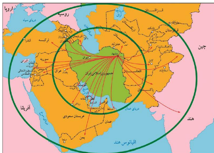
شکل ۵: نقش مشهد در ژئوپلیتیک شیعه و مدل مرکز-پیرامون (نامی، ۱۳۹۲: ۱-۱۳)

تبلیغات بی‌وقفه آنها تاکنون به سختی محقق شده است. مشهد، دومین کلان‌شهر مذهبی دنیاست، اما سهمی که تاکنون از زائران خارجی کسب کرده، با پتانسیل‌هایی که در این شهر وجود دارد، تحت هیچ شرایطی قابل مقایسه نیست.