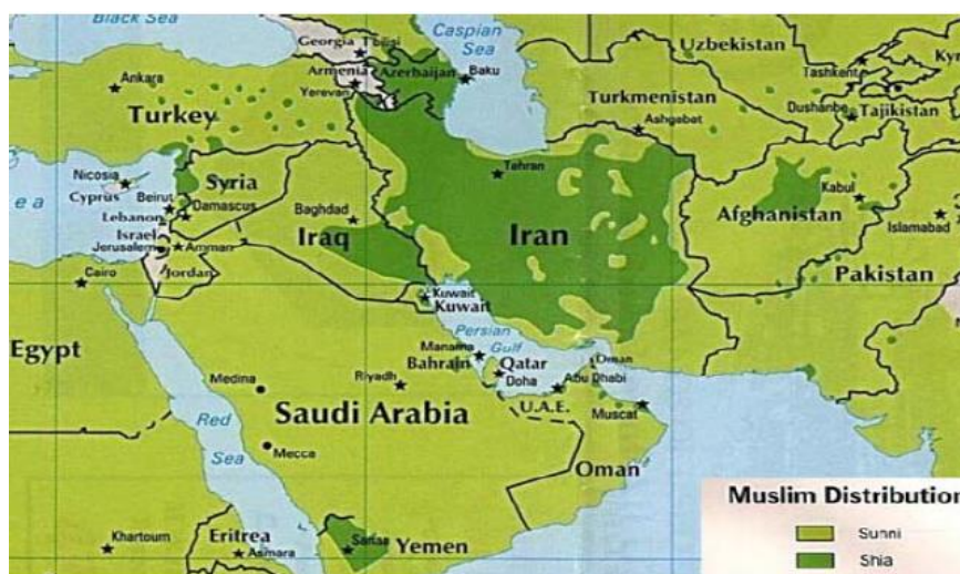
شکل ۴: جغرافیای شیعه (Nasr, 2006: 25) Source:

شیعی قبل از تحولات اخیر در عراق محسوب می‌شد و مرکز اصلی مذهب شیعه و حمایت از شیعیان تحت لوای نظام جمهوری اسلامی ایران به حساب می‌آمد (Ahmadi, 2010: 48).