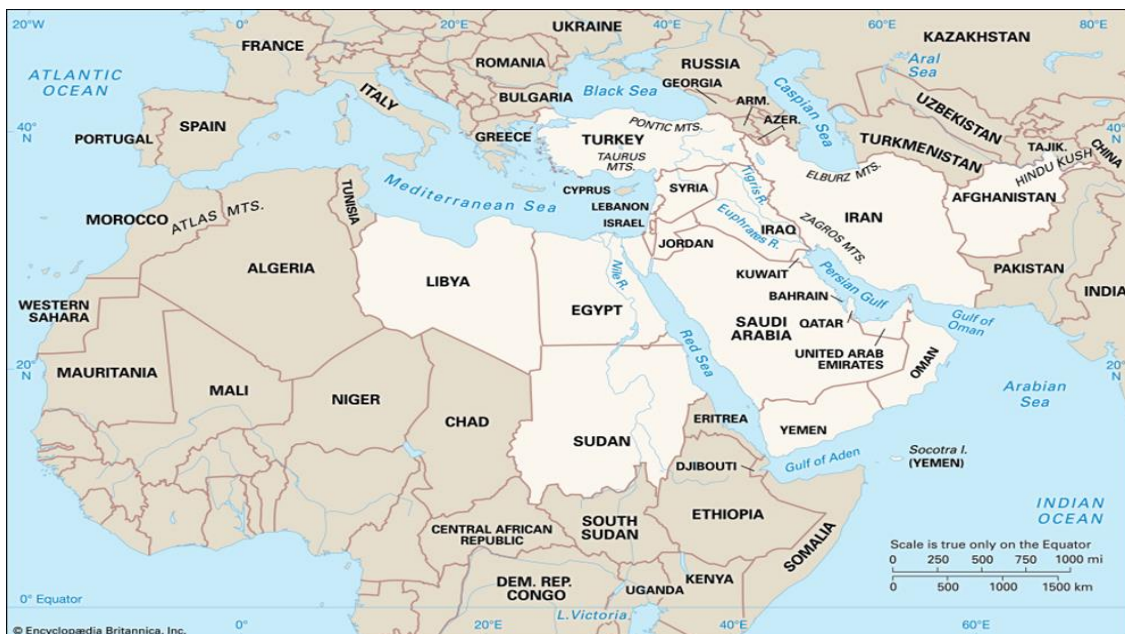
نقشه ۳- محیط پیرامونی خاورمیانه