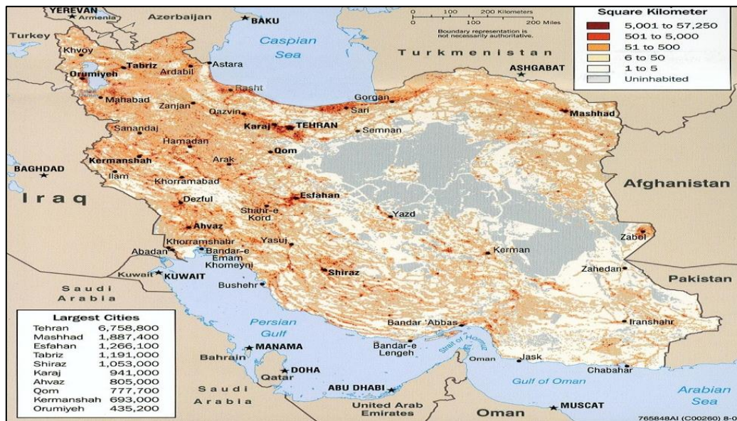
نقشه ۳. پراکنندگی و سکونت جمعیت در ایران