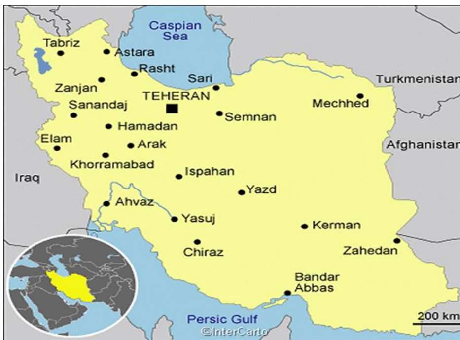
نقشه ۱. موقعیت جغرافیایی ایران

ایران با نام رسمی جمهوری اسلامی ایران در آسیای غربی واقع است. در شمال غرب با ارمنستان، جمهوری نیمه‌رسمی قره‌باغ و جمهوری آذربایجان، در شمال با دریای خزر، در شمال‌شرق با ترکمنستان، در شرق با افغانستان و پاکستان، در جنوب با دریای عُمّان و خلیج فارس و در غرب با ترکیه و عراق، کرانمند است و مرز خاکی دارد (مسعودیان، ۱۳۸۲: ۱۷۲). ۱۶۴۸۱۹۵ کیلومتر مربع مساحت دارد که دومین کشور بزرگ خاورمیانه و هجدهمین در جهان می‌باشد. با ۸۲/۸ میلیون نفر جمعیت، هفدهمین کشور پرجمعیت جهان است. تنها کشوری است که با هر دو دریای خزر و اقیانوس هند خط ساحلی دارد. جایگیری ایران در اوراسیا و غرب آسیا و نزدیکی آن به تنگه هُرمُز، به این کشور برجستگی ژئوپولیتیکی بخشیده است. تهران پایتخت کشور و بزرگترین شهر ایران است و همچنین قانون پیشتاز اقتصادی آن (همان، ۱۳۸۲: ۱۷۶).