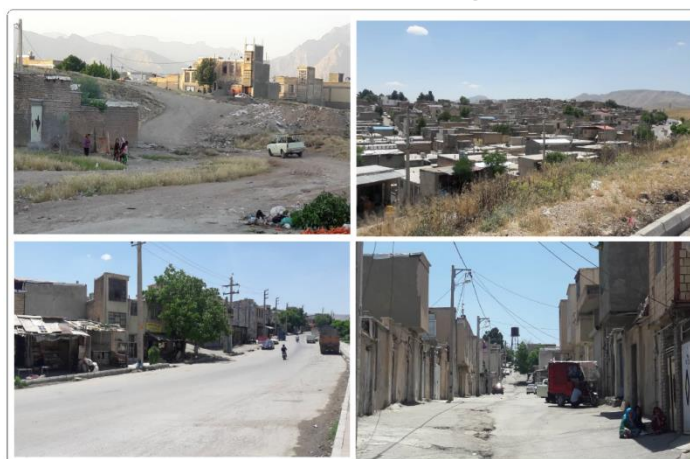
شکل ۴. نمایی از سکونتگاه‌های غیررسمی جعفرآباد