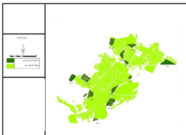
شکل ۲. سکونتگاه‌های غیر رسمی کرمانشاه در سال ۹۵

بوده موجبات مهاجرت و ورود به شغل‌های کاذب را فراهم کرد که بدین گونه حاشیه‌نشینی در کرمانشاه نیز شکل گرفت و این در حالی است که اگر مسئولان ساماندهی مشاغل روستایی به رفع تنگناها و چالش‌های روستا و روستانشینان می‌پرداختند این اتفاق نمی‌افتاد. ۳- یکی دیگر از عوامل حاشیه‌نشینی وسعت و گسترش بی‌رویه شهر کرمانشاه است به ویژه در تعریف موقعیت شهری وارد کردن روستاهای مجاور شهر به عنوان بخشی از شهر کرمانشاه که ظاهراً و از نظر جغرافیایی این تغییرات فقط از نظر اسمی اتفاق افتاد ولی در موقعیت پیشین آنها تغییر حاصل نشد که به این ترتیب این وسعت شهری از نظر جغرافیایی علاوه بر آنکه شهریت و شهرنشینی را وسعت نداد، موجب گسترش حاشیه‌نشینی با نام و نشان شهرنشینی شد (همان منبع).