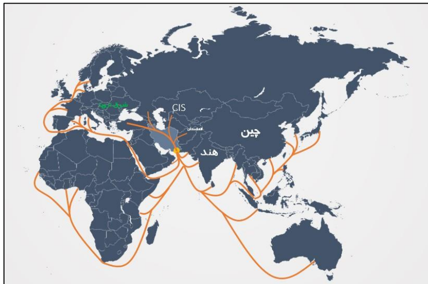
(سازمان منطقه آزاد چابهار، ۱۳۹۸)

براساس اعلام نظر محققان سازمان ملل در زمینه حمل و نقل بین‌المللی، حدود نیمی از حمل و نقل جهان، میان خاور دور با سایر نقاط دنیا انجام می‌شود. از مجموع سه کریدور حمل و نقل جهانی که کارشناسان سازمان ملل برای این امر پیش‌بینی کرده‌اند، دو کریدور از ایران می‌گذرد و چابهار جنوبی‌ترین نقطه کریدور شرقی - غربی جهان می‌باشد. این کریدور از «دروازه ابریشم» در چین آغاز می‌شود و قلب اقتصاد این کشور یعنی استان کانتون را تغذیه کرده و به سرزمین آسیای جنوب شرقی می‌پیوندد و پس از طی این مسیر وارد هندوستان شده و با پوشش مهمترین شهرهای این ناحیه مانند کلکته، ناکپور، جایپور، حصیرآباد، کراچی و بن قاسم به چابهار می‌رسد. بنا به نظر کارشناسان بندر چابهار، محل تلاقی دو کریدور ترانزیتی مهم جهان به نام‌های شمال - جنوب و شرق - غرب قرار گرفته است که این امر از مهم‌ترین مزیت‌های محور شرق کشور می‌باشد.