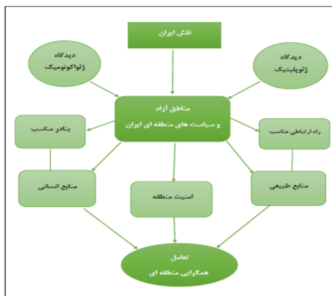
نمودار ۱. مدل مفهومی؛ مناطق آزاد و سیاست‌های منطقه‌ای

برای ترسیم نقشی نوین در آینده برای مناطق آزاد لازم است دو رویکرد مهم اقتصاد دانش محور و جهانی شدن مد نظر قرار گیرد. خوشبختانه در اهداف برنامه چهارم این رویکردها لحاظ شده و نقشی قابل توجه به مناطق آزاد اعطا شده است. در نظامات امروزی جهان حضور علم در همه تصمیمات، قواعد و قوانین و در تمام شئون اجتماعی، اقتصادی، سیاسی و فرهنگی و حتی نظامی قابل مشاهده است و بر این اساس قرن بیست و یکم را قرن دانش محور اطلاق می‌کنند. بر مبنای اقتصاد دانش محور، توسعه ملی در هر کشور به میزان ارزش اقتصادی تولیدات آن کشور بستگی دارد که در زنجیره ارزش اقتصاد جهانی ایجاد می‌شود. بر این اساس لازم است مناطق آزاد به مناطقی تبدیل شوند که در امکان ایجاد تعامل میان دانش و تولید و تجارت تسهیلات بیشتری فراهم نمایند. از سوی دیگر با جهانی شدن اقتصاد شاهد آن هستیم که تولید و تجارت جهانی گسترش یافته و کشورها با عضویت در سازمان جهانی تجارت و گسترش به حذف موانع تجاری و گسترش تجارت نائل موافقتنامه‌های تجاری منطقه‌ای (RTAs) آمده‌اند.