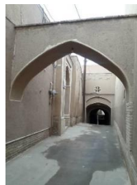
محله ته باغ شه

این محله از شمال به خیابان ابوحامد و از جنوب به خیابان شریعتی و از سمت غرب توسط خیابان فلسطین و از سمت شرق به خیابان شهید فرزاد مقدم احاطه شده است.