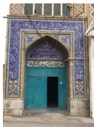
محله خواجه خضر

این محدوده حد فاصل بین خیابان های ابوحامد شمال، خیابان فلسطین در غرب، خیابان شهید چمران در شرق و خیابان فلسطین ۵ در جنوب واقع گردیده است .