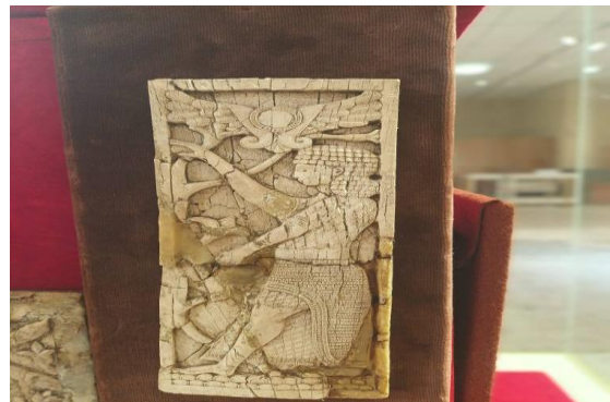
تصویر ۱۱. نقش برجسته از عاج-رب النوع آشور در نمود ۹۱۱-۶۱۲ قبل از میلاد مسیح ۱۴۰۱/۶/۲۱

داعش نه تنها در تخریب ید طولایی داشت بلکه با شکلی دیگر باعث نابودی و تاراج آثار تاریخی گشته است، این گروه با جابجا کردن آثار کشورهای تحت اشغال خویش به دنیای مجموعه داران تاریخی جهان اقدام کرد، و با فروش این آثار مقداری از هزینه های خویش تأمین می کرد، «گروه تروریستی، افراط گرایانه، و تکفیری داعش، به محض روی کارآمدن سعی در از بین بردن برخی از این آثار تاریخی و باستانی و یا در صورت لزوم غارت و فروش آن ها کرد».(همان)