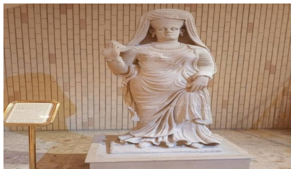
تصویر ۱۳. مجسمه (ابوبنت دمبون) همسر پادشاه سنطووق اول. در دوره هیلینی شهر حضر- موزه ملی عراق- بغداد ۱۴۰۱/۶/۲۱