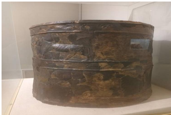
تصویر ۱۲. حوض استوانه ای که از مس ساخته شده و در شهر خرس اباد پیداشد ۷۰۰ قبل از میلاد مسیح موزه ملی عراق. عکاس احمد شولی ۱۴۰۱/۶/۲۱

این گروه نه تنها آثار تاریخی، هنری و فرهنگی عراق مورد تاخت و تاز خود قرار داد بلکه کشور همسایه عراق، دیگر پایگاهی که برای خود در نظر گرفت که همان سرزمین شام و یا سوریه کنونی است، کشور سوریه با عراق از سمت شرق هم مرز است، و نیز با ترکیه از سمت شمال، با اردن و لبنان از قسمت جنوب و جنوب غربی و دریای مدیترانه غرب این کشور واقع می باشد. هر دو کشور، عراق و سوریه، آثار و اماکن تاریخی، مذهبی و هنری توسط داعش مورد انهدام و نابود سازی قرار گرفت، در این باره صیانت و مرمت این اماکن وظیفه ای است که در پرتو مناسبات بین المللی و تعهدات جهانی قرار می گیرد، و نیز الزامات و تصمیم گیری جدی از محافل و اجلاسهای ذی ربط خواستار است، «حفاظت از آثار باستانی، تاریخی، فرهنگی و مدیریت در این زمینه و حفاظت به طور انفرادی تا حدودی از عهده دولت ها خارج است و به همبستگی جهانی نیاز دارد» (حیدری، ۱۳۹۴).