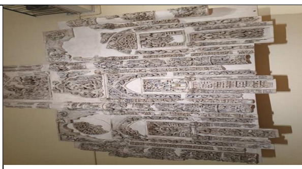
تصویر ۳. قسمتی از دیوار داخلی مسجد نوری که بصورت گچ بری کار شده - قرن ۱۲ میلادی - ششم هجری - موزه ملی عراق بغداد ۱۴۰۱/۶/۲۱