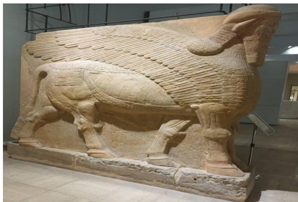
تصویر ۱۵. مجسمه سنگی گاو بالدار که در کاخ آشور ناصر بال دوم (۸۸۳-۸۵۹) قبل از میلاد در شهر نمرود. موزه ملی عراق - بغداد ۱۴۰۱/۶/۲۱

افکار خویش، جهانیان را و رأی عمومی اکثر قریب به اتفاق محافل بین المللی شگفت زده کرد، از جهتی همین گروه منفور از همه محافل جهانی، پس از اشغال قسمتی از سوریه و عراق، بطور ضمنی مورد توجه همین مناسبات میان این کشورها گشته است، بطوریکه دادو ستد مشترک در همه زمینه‌ها آغاز شد.