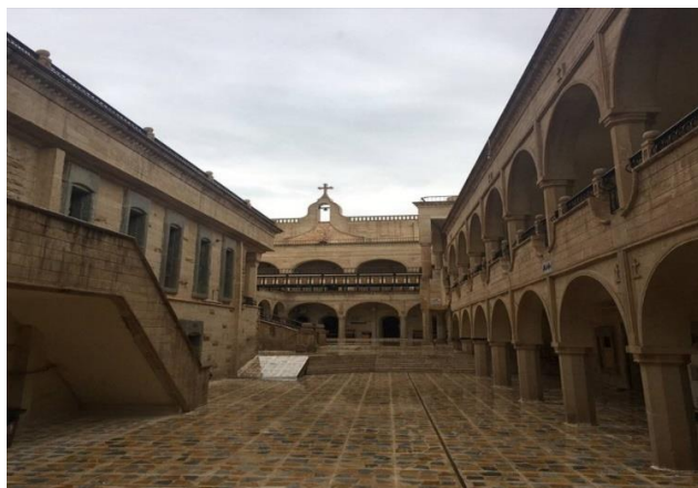
تصویر ۸. کلیسای مار توما - موصل مارس ۲۰۱۹ ar.tripadvisor