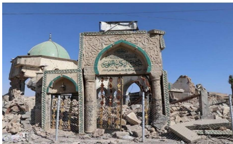
تصویر ۶. درب ورودی مسجد نوری پس از تخریب - موصل 5/15/2018

همینطوریکه در این بحث درباره اندیشه‌های داعش مروری کردیم، و درباره تخریب و ویران کردن اماکن دینی مذهبیو جاهای تاریخی تذکری داده شد. داعش این پدیده جدید آغاز به تخریب نمود، و جاهای بسیاری در موصل و شهرهای نزدیک موصل، مورد تاخت و تاز و تخریب قرار داد. از جمله جاهائی که مورد تعرض قرار گرفت می‌توان بصورت ذیل نام برد.