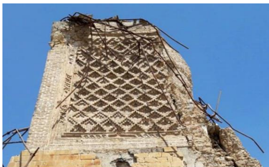
تصویر ۲. منار حرباء تخریب شده توسط داعش - aljazeera.net 15/5/2018

هرچند که باورهای دینی مقابل داعش که نسبت به اینگونه تاجر موضع می گرفتند، نظری مخالف و عملکردی متضاد دارند، بطوریکه شهر موصل در دوره های مختلف تاریخی شاهد مرمت و اعاده بنا شده بود، «دین و هنر از همان آغاز رابطه صمیمانه ای با هم داشته اند. این که دین همیشه سرچشمه پایان ناپذیری از بیان هنری بوده است». (همان) نمونه ای از اینگونه اتفاقات، می توان مرمت کردن منار معروف مسجد نوری شهر موصل، که با منار " الحدباء " معروف است، و نیز شهر موصل با نام این منار آمیخته شده، چرا که یکی از نام های شهر موصل ( الحدباء ) می باشد.