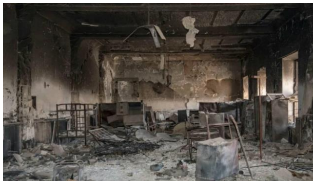
تصویر ۱۰. موزه موصل پس از غارت و تخریب توسط داعش