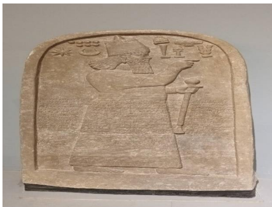
تصویر ۹ - نقش برجسته از مرمر - دوره پادشاه نیراری سوم ۸۱۰-۷۳۸ قبل از میلاد مسیح ۱۴۰۱/۶/۲۱