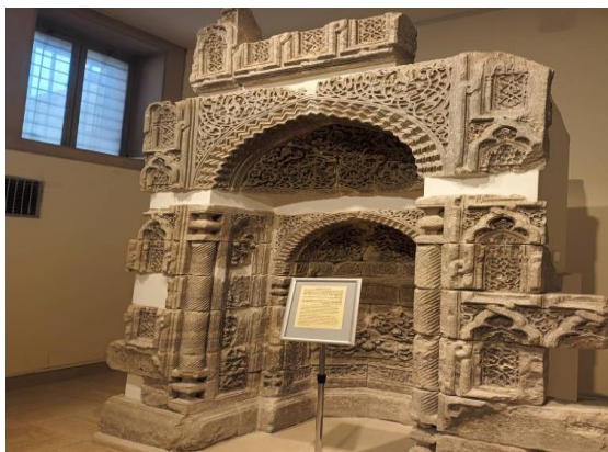
تصویر ۱۶. محراب مسجد نوری - قرن ششم هجری - موزه ملی عراق - بغداد عکاس احمد شولی ۱۴۰۱/۶/۲۱

"حفاظت از میراث فرهنگی جزئی از حقوق بین المللی بشمار می رود"، (صلاحی، ۱۳۹۶).