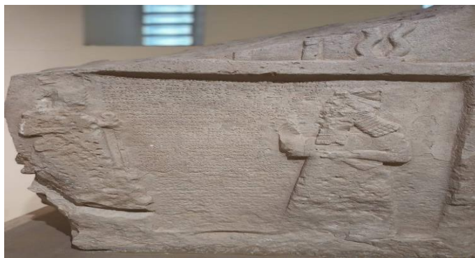
تصویر ۷. کتیبه سنگی - پادشاه آشوریدر مقابل پادشاه بابل - ۹۱۱-۶۱۲ - قبل از میلاد - موزه ملی عراق - بغداد - عکاس احمد شولی ۱۴۰۱/۶/۲۱