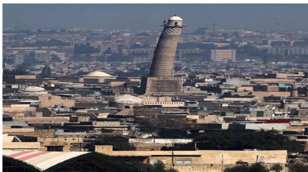
تصویر ۱. منار کج در شهر مناره - منار حرباء مسجد نوری - شهر موصل