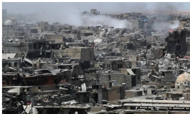
تصویر ۵. خرابه های منطقه قدیم موصل-۲۰۱۷- عکاس احمد الربیعی the guardian.com

صحت و سقم مسائل از نگاه داعش غربال و الک می شود، این بار سرزمین عراق، شهر موصل، مورد جولان و تاخت و تاز داعش شد. گروه نامبرده تکیه بر مؤلفه های خویش مسائل و امور بی ارزش و گمراه کننده چون هنر به زعم این گروه انسان را از تقوی دور می کند، تعلقات مادی همچون بنا، ساختمان، عمارت آثار هنری و حتی قبور و آرامگاه های تاریخی، بی ارزش، فاقد اعتبار و هدم و تخریب شان یک امر عقلانی و منطقی می دانند. "اوج کشمکش میان هنر و دین را در ریاضت منشی اصیل می توان یافت، این نوع ریاضت منشی هرگونه واسپاری مومنان به ارزشهای زیبایی شناختی را نقض جدی نظام مندی عقلانی رفتار در زندگی می انگارد". (وبر، همان).