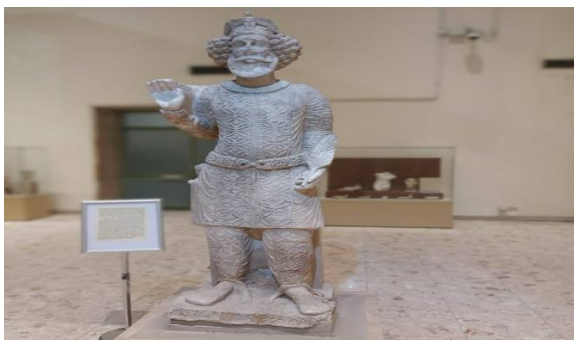
تصویر ۱۴. مجسمه سنگی پادشاه سنطووق از دوره هیلینی (۳۱۲-۱۳۹) قبل از میلاد. در قسمت پایین مجسمه با خط آرامسی حکاکی شده موزه ملی عراق- بغداد ۱۴۰۱/۶/۲۱

داعش نه تنها در تخریب ید طولایی داشت بلکه با شکلی دیگر باعث نابودی و تاراج آثار تاریخی گشته است، این گروه با جابجا کردن آثار کشورهای تحت اشغال خویش به دنیای مجموعه داران تاریخی جهان اقدام کرد، و با فروش این آثار مقداری از هزینه های خویش تأمین می کرد، «گروه تروریستی، افراط گرایانه، و تکفیری داعش، به محض روی کارآمدن سعی در از بین بردن برخی از این آثار تاریخی و باستانی و یا در صورت لزوم غارت و فروش آن ها کرد».(همان)