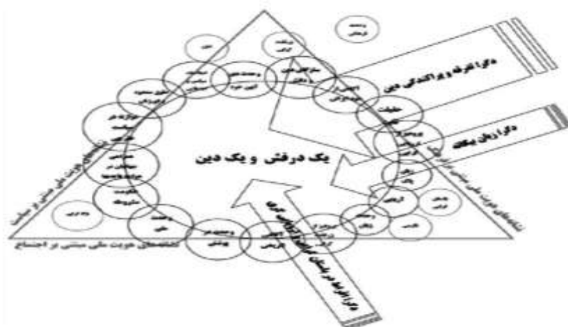
شکل ۱- گفتمان وحدت سرزمینی کسروی

تبیین کسروی از این که چرا ایران عقب ماند این است که «علت رشد نیافتگی ایران چندپارگی آن بود. امپریالیست‌ها فرقه‌های مختلف را پدید نیاوردند: آنها تنها از وجودش سوء استفاده کردند؛ در نظر، کسروی تنها ایدئولوژی‌های راستین - نه قدرت‌های تحمیلی، نه قانون و نه نهادهای دولتی می‌توانند گروه‌ها و افراد متنازع را در قالب ملتی به هم پیوسته گرد هم آورند آبراهامیان (۱۳۹۰) کسروی در نهایت چنان آنتونی اسمیت (۲۰۰۳: ۴۵) معتقد است که ملی‌گرایی در معنای واقعی خود می‌تواند یک مذهب باشد و یک ارتباط عاطفی بین مذهب و احساسات ملی‌گرایانه وجود دارد؛ کسروی نیز آرزو داشت کارزاری ملی برای حذف دستجات موجود در کشور به پا کند، ولی او تنها دسته جدیدی ایجاد کرد. از ترکیب دال‌های اصلی حوزه گفتمانی کسروی با یکدیگر زنجیره هم‌ارزی شکل می‌گیرد این دال‌ها به خودی خود معنایی ندارند و از طریق زنجیره هم‌ارزی با لحاظ نمودن واژه «وحدت» که به آنها معنا می‌بخشد ترکیب می‌شود هویت ملی کسروی ذات‌گرا است هر چند در ادامه شاهد خواهیم بود که از جاشدگی انقلاب اسلامی ۱۳۵۷ سبب شد این گفتمان با جریان گفتمان لیبرالیسم هم‌مرز و هم‌دیوار شود اما در حوزه گفتمانی قبل از انقلاب این جریان گفتمان بر حقیقت ثابت مبتنی بر وحدت تأکید داشت.