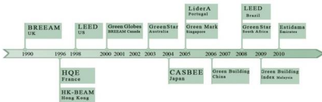
نمودار ۲. روند تدوین سیستم‌های امتیازدهی زیست محیطی ساختمان