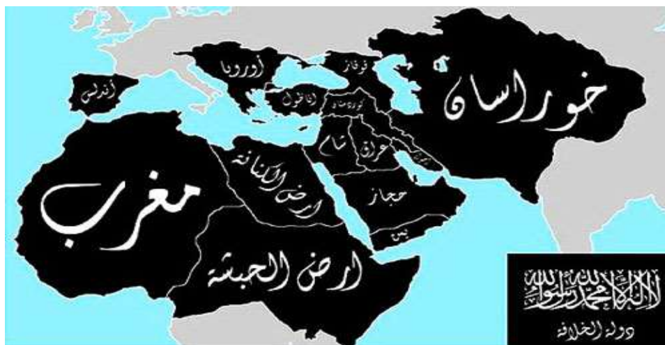
۲. نقشه آرمانی گروه‌های بنیادگرای سلفی-تکفیری از منطقه خاورمیانه که بر مبنای نظریه سنتی دارالاسلام و برجیده شدن مرزهای جغرافیایی دولت-ملت مدرن تدوین گردیده است.

منبع: سایت تابناک : https://www.tabnak.ir/fa/tags/4684/1/