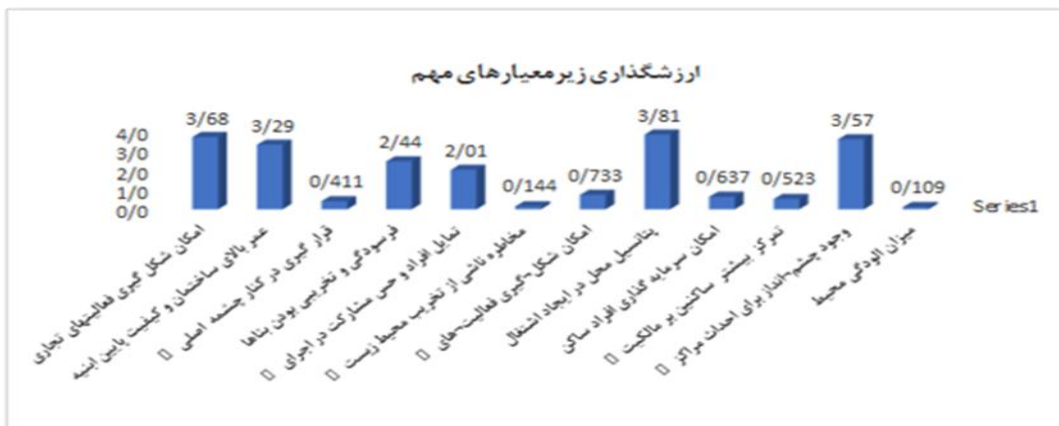
نمودار ۱: ارزش گذاری زیر معیار مهم و دارای اهمیت بیشتر

همچنین در ارزش گذاری شاخص اقتصادی نیز معیارهای امکان شکل گیری فعالیت های اقتصادی با حصول امتیاز ۰/۷۳۳ و امکان سرمایه گذاری افراد ساکن محل با توجه به درصد بالای مالکیت خصوصی، دارای ارزش بیشتری از نظر کار محققین قرار گرفته است.