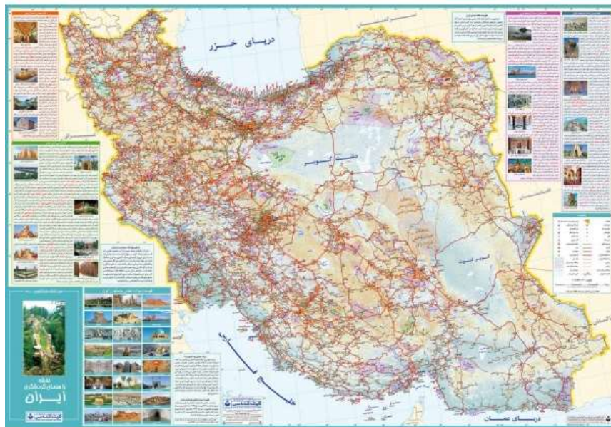
شکل ۱. نقشه ایران