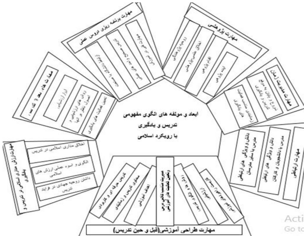
شکل ۱- شکل به دست آمده از بخش کیفی

نسبت به ارزیابی اساتید در اکثر مؤلفه‌ها وجود دارد، که این امر نیاز به بررسی و بهبود روش‌های تدریس و یادگیری در این مراکز را نشان می‌دهد.