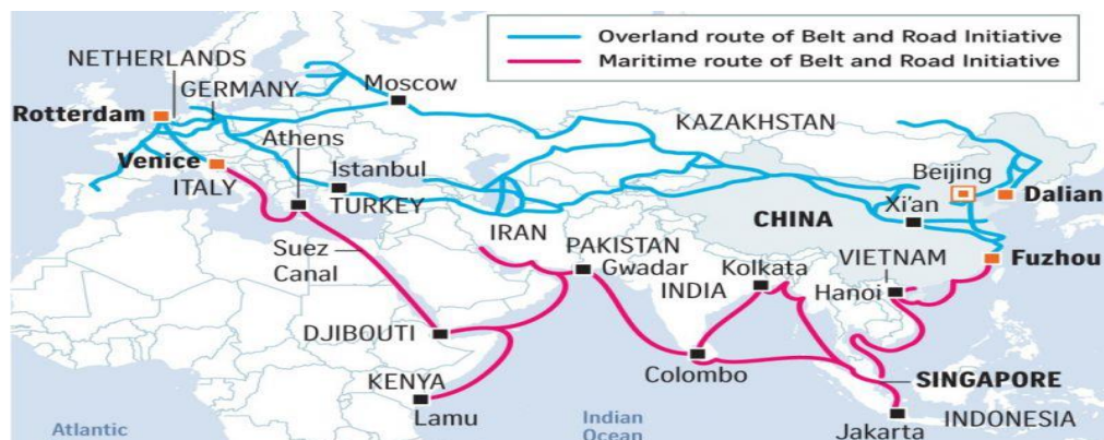
شکل ۱- نقشه ابتکار یک کمربند، یک جاده