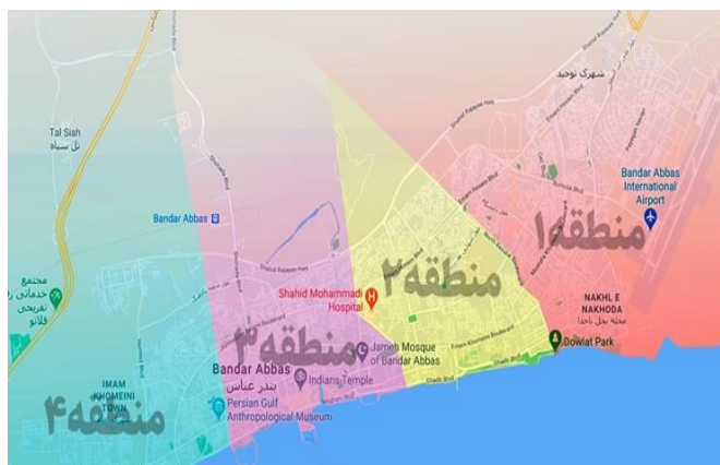
شکل ۳- نقشه مناطق شهرداری بندرعباس