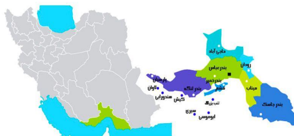
شکل ۲- موقعیت شهر بندرعباس در استان هرمزگان

در تقسیمات فعلی کشوری شهر بندرعباس مرکز استان هرمزگان و یکی از مهم‌ترین مراکز راهبردی و بازرگانی ایران در جوار خلیج فارس و دریای عمان می‌باشد. موقعیت ویژه و مناسب بندرعباس، موجب جذب و حضور اقوام ایرانی متفاوتی در منطقه شده است (زیاری، ۱۳۹۸). شهرستان بندرعباس، مرکز استان هرمزگان با جمعیتی حدود ۶۱۴۹۶۶ هزار نفر در سال ۸۹۳۱ و با دربرداشتن ۱۴۹۲۸۹ نفر از جمعیت شهری، بزرگترین شهر استان و در زمره شهرهای متوسط کشور به حساب می‌آید (سرشماری نفوس، ۱۳۹۵). این شهر به سبب موقعیت جغرافیایی خود نقطه‌ی مهم مراسلات دریایی-جاده‌های کشور است. نقش بندری و اقتصاد مبتنی بر خدمات بندری با شعاع عملکردی فرااستانی، ملی و حتی فراملی، این شهر را یکی از سایر شهرهای استان متمایز ساخته است. شهر بندرعباس به سبب قرارگیری در کرانه‌های شمالی تنگه هرمز دارای ویژگی‌های یک شهر ساحلی است. ویژگی‌های بارز شهرهای ساحلی، توسعه کالبدی آنها در طول ساحل است. از همین رو شهر بندرعباس یک شهر خطی محسوب می‌گردد چنانچه طول بافت شهر در لبه ساحل دریا به ۱۶۰۰ متر می‌رسد، در حالی که عمق آن در بیشترین حد به ۵۵۰۰ متر (حاشیه شرقی شهر) و در کم‌ترین مقدار به ۷۰۰ متر (در حاشیه غربی) می‌رسد (زیاری، ۱۳۹۸).