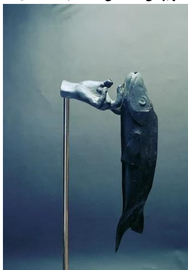
شکل ۴. مجسمه صید ماهی، اثر بهمن محمص، مأخذ: ( https://asarartmagazine.ir )