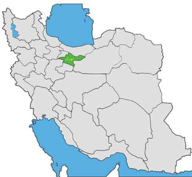
شکل ۱. موقعیت شهر تهران در نقشه

شهر تهران ، پایتخت و پرجمعیت ترین شهر ایران در شمال کشور و در دامنه رشته کوه البرز قرار دارد که با مساحت ۷۳۰ کیلومتر مربع عنوان بیست و هفتمین شهر بزرگ جهان را به خود اختصاص داده است. این شهر با جمعیتی بالغ بر ۱۳ میلیون نفر پرجمعیت ترین شهر ایران است که ۵/۱۷ درصد جمعیت کل کشور را در خود جای داده است و رشد جمعیت شهر تهران ۱/۴ درصد است که در مقایسه با دهه قبل اندکی افزایش یافته است (اسلامی، ۱۳۹۵)، از دید ناهمواری‌های طبیعی، تهران به دو ناحیه ی دشتی و کوهپایه‌ای البرز تقسیم می‌شود و گستره کنونی آن از ارتفاع ۹۰۰ تا ۱۸۰۰ متری از سطح دریا امتداد یافته است. تهران دارای اقلیم نیمه‌خشک است. در بیشتر سال‌ها، فصل زمستان نیمی از کل بارش‌های سالانه تهران را تأمین می‌کند و تابستان نیز کم‌باران‌ترین فصل در تهران است (اسلامی، ۱۳۹۵)