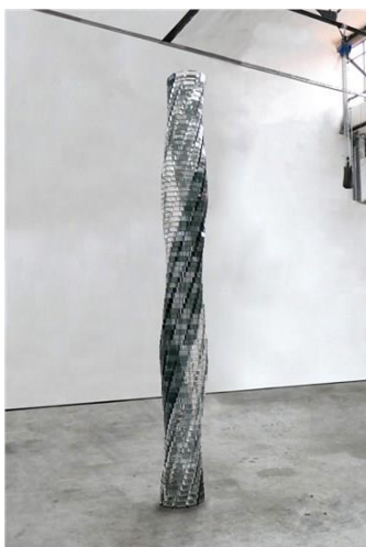
شکل ۱۱. برج آجری استوانه ای، اثر شیرازه هوشیاری، مأخذ: ( galleryinfo.ir )

اثر مشهور دیگر شیرازه هوشیاری، برج آجری استوانه ای شکلی است که بدون شک وجود آن در موزه های هنرهای تجسمی جلوه گری ویژه ای خواهد داشت؛ تصویر این اثر را ذیلاً می بینیم: