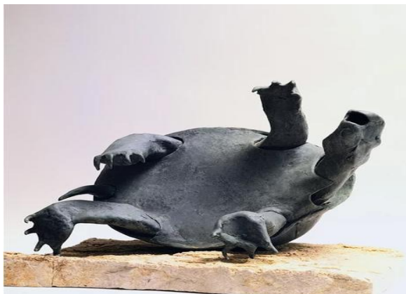
شکل ۶. تابلوی لاک پشت، اثر بهمن محمص

در تصویر زیر، لاک پشت وارونه ای دیده می شود که دهان باز و چشمان گرد او بیانگر حال ناخوش آن است. این حیوان در شرایط بدی قرار گرفته و گویی یک لاک پشت دریایی است که از دریا به خشکی افتاده و یا آب آلوده دریا مانع از بازگشت او به دریا شده است: