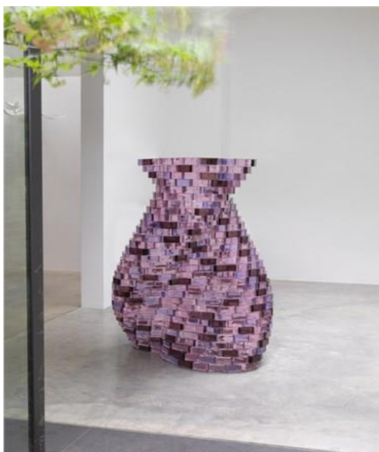
شکل ۱۰. برج آجری کوزه ای، اثر شیرازه هوشیاری