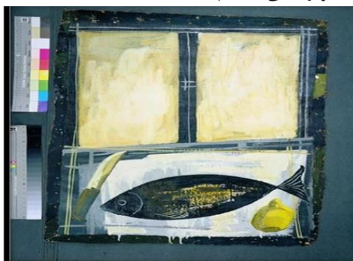
شکل ۳. تابلوی ماهی، اثر بهمن محمص، مأخذ: ( https://asarartmagazine.ir )

در غالب کشورهایایی که بنادر کشتی رانی و صنعت ماهیگیری دارند، ماهی نشانه ای از رستگاری، زندگی، زایش، گردش و قوس زمین است. در تابلوی زیر شاهد تصویر ماهی هستیم: