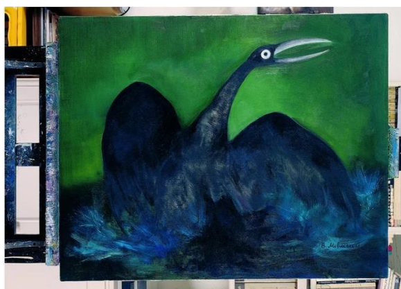
شکل ۵. تابلوی لک لک، اثر بهمن محمص