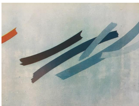
شکل ۶. چپ: عنوان نامعلوم، ۱۳۵۶، رنگ روغن روی بوم، ۹۶ در ۱۲۹ سانتیمتر.