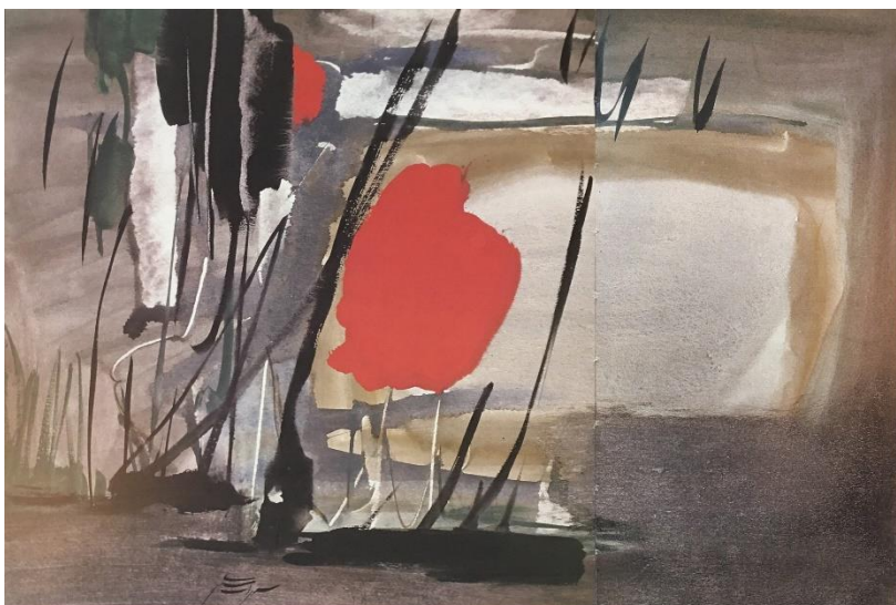
شکل ۲. چپ: تنه های اریب، حدود ۱۳۵۰، رنگ روغن روی بوم، ۱۲۰ در ۸۰ سانتیمتر، موزه هنرهای معاصر تهران.