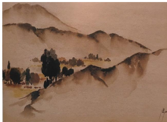
شکل ۵. راست: آبدی، ۱۳۵۷، آبرنگ روی کاغذ، ۳۵/۵ در ۲۵/۵ سانتیمتر، از مجموعه خانواده سپهری.