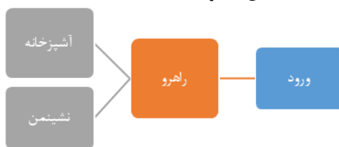
شکل ۵. دیاگرام ارتباطی قشر ثروتمند آشپزخانه و خانه ۱۳۵۰ تا ۱۳۷۰

در هر دو گونه، اصل معماری ایرانی در تفکیک فضای مهمان و فضای خصوصی کم و بیش برقرار است و آشپزخانه در قسمت میانه بین اندرونی و بیرونی خانه قرار گرفته است. در این دوره فضای آشپزخانه نسبت به دهه‌های قبل بیشتر شده و میانگین آن در نمونه‌های بررسی شده ۱۳/۲۵ درصد مساحت کل بنا بوده است.