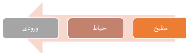
شکل ۲. دیاگرام ارتباطی مطبخ و خانه قبل از ۱۳۰۰ هجری شمسی

در این خانه محل طبخ ۵ درصد از مساحت فضای مسکونی را به خود اختصاص داده است و بطور کلی بنا به دو قسمت رفاهی و خدماتی تقسیم می شد که مطبخ در قسمت خدماتی قرار داشته و دسترسی از داخل حیاط امکان پذیر است. تهویه و نورگیری به وسیله ی سقف میسر شده و همچنین محل نگهداری و ذخیره ی مواد خام نیز بوده است. سرداب در طبقه زیرزمین (هنوز یخچال وارد فضای خانه نشده) -حوض در حیاط اندرونی و برای کاربری های شست شو مورد استفاده قرار می گیرد. (هنوز لوله کشی آب شهری وجود ندارد).