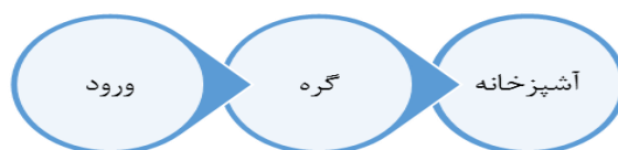
شکل ۴. دیاگرام ارتباطی واحد های مسکونی پارک پرنس

نمونه‌های انتخابی این دو دوره، مجتمع مسکونی پارک پرنس برای قشر متوسط و خانه مسکونی کامرانیه برای قشر ثروتمند می‌باشد. در ساختمان کامرانیه طراح از الگویی استفاده کرده که در اثر آن، روابط بین واحدها بیش از واحدهای یک آپارتمان امروزی است، به این ترتیب که: حیاطی در میانه قرار گرفته و واحدها به گونه‌ای در اطرافش جای گرفته‌اند که گویی افرادی بر گرد یک سفره نشسته‌اند. در این خانه آشپزخانه پس از ورودی و در کنار سرویس بهداشتی و به صورت یک اتاقک بسته در نظر گرفته شده است.