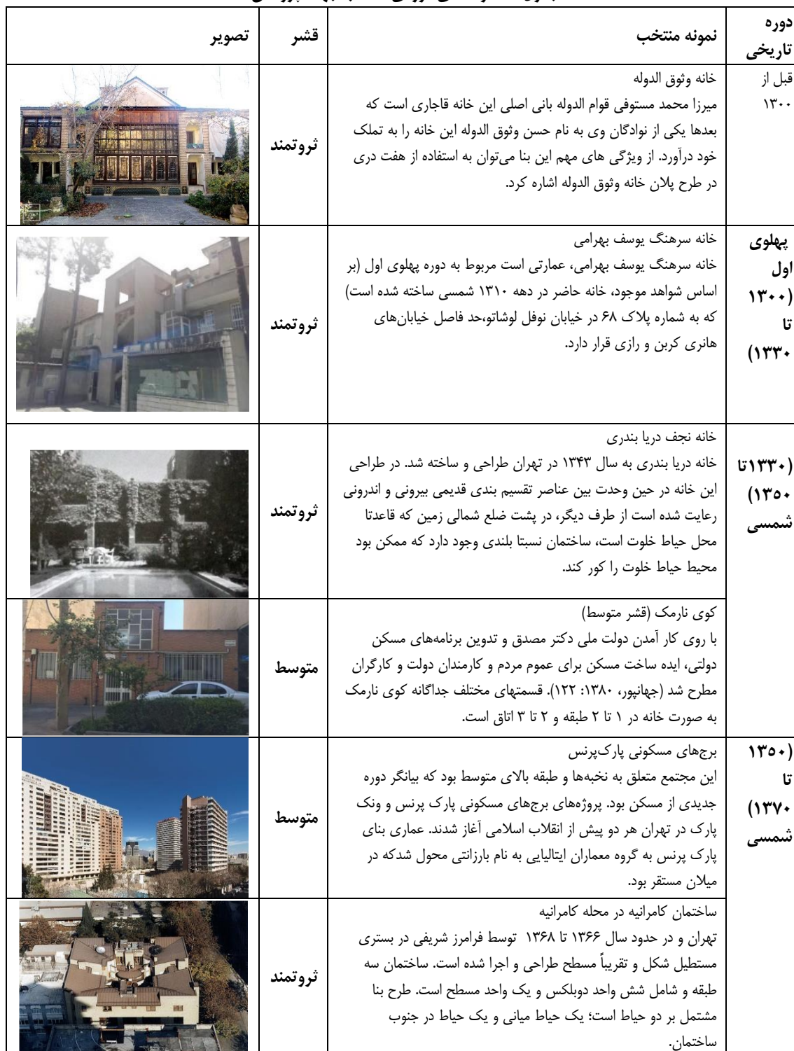
جدول ۱. نمونه های موردی منتخب جهت پژوهش