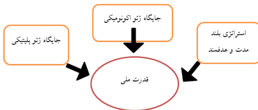
شکل ۳. جایگاه ژئوپلیتیک