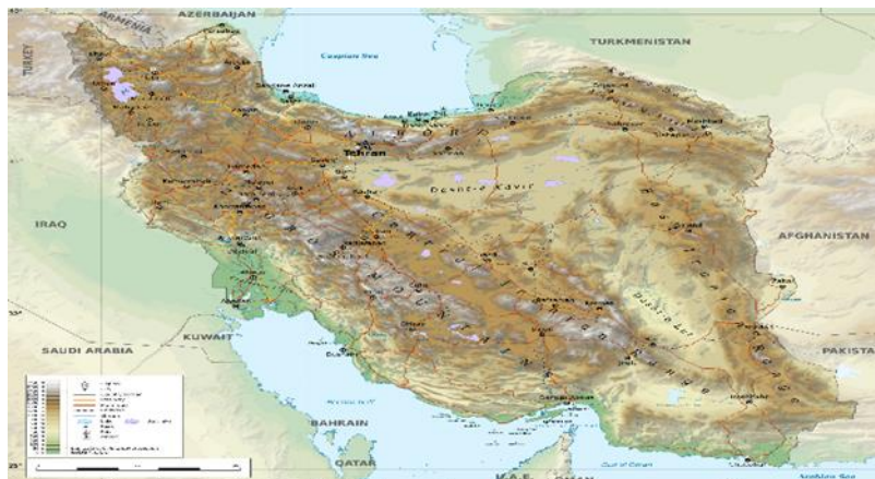
شکل ۱. نقشه جغرافیایی سیاسی ایران

کلی در جنوب غرب آسیا هفت واحد جغرافیایی یا هفت منطقه طبیعی مشاهده می‌شود که هر یک وحدت خاص خویش را دارند این واحدها عبارتند از: آسیای صغیر، ارمنستان، قفقاز، ایران، عربستان، سوریه و بین‌النهرین. (همان مأخذ، ۳۸) با نگاهی به نقشه طبیعی آسیای جنوب غربی می‌توان تشخیص داد که سه منطقه نخست کاملاً کوهستانی و سه منطقه آخر اساساً جلگه‌ای، دشتی و هموار است.