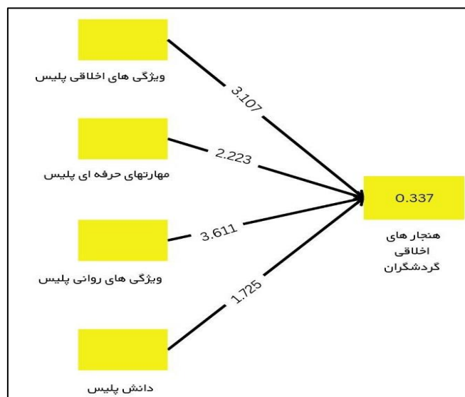
نمودار ۲. تحلیل مدل رگرسیونی

مطابق نمودار تحلیل رگرسیونی متغیرهای ویژگی های اخلاقی، مهارت های حرفه ای پلیس و ویژگی های روان شناختی که بر متغیر تحقیق (رعایت هنجارهای اخلاقی از سوی گردشگران) تاثیر دارند، و بدین ترتیب، متغیرهای مستقل تحقیق توانستند ۳۳ درصد از رعایت هنجارهای اخلاقی از سوی گردشگران را تبیین کنند. بنابراین ۶۷ درصد از پیش بینی کنندگی این متغیر توسط متغیرها و عوامل دیگری تبیین می شوند که در این تحقیق مدنظر قرار نگرفته است.