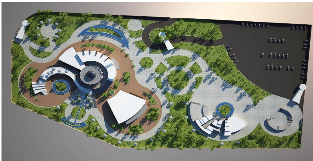
شکل ۴- فضای کلی پروژه