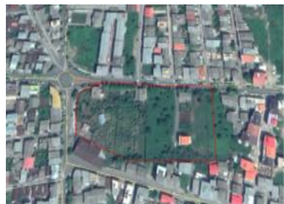
شکل ۱ (ب) موقعیت مکانی منطقه