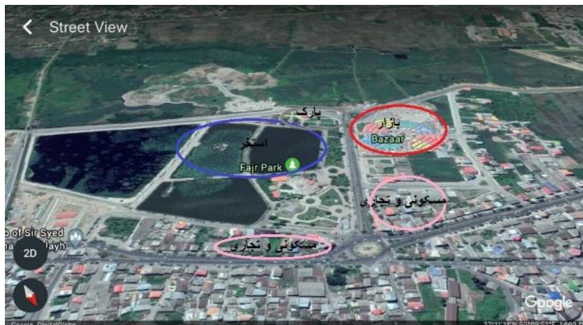
شکل ۲- همسایگی سایت

تصاویر مربوط به شناسایی همسایگان پروژه و جانمایی آن در ادامه ارائه شده است.