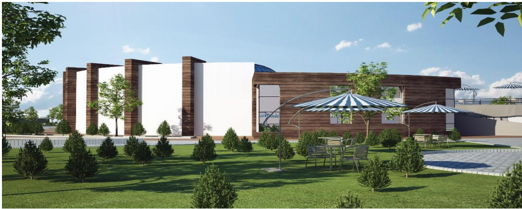
شکل ۷- نمایی دیگر از ساختمان اصلی پروژه

طراحی این مجموعه به عنوان یک نماد شهری، می تواند آن را به یک جاذبه تفریحی و آموزشی برای مردم این شهر تبدیل کند. طراحی فضایی که بتواند توجه شخص را به معماری بسیار زیبا و غیرمعارف جلب کند و به شکل ارادی و غیرارادی او را در مسیری خطی در عبور از فضاهای مختلف این مجموعه قرار دهد، ضمیر خودآگاه و ناخودآگاه شخص در عین پرسه زنی و با نگاهی کاملاً عمیق و حتی سطحی به اطراف خود گام محکم و تأثیرگذار بعدی خود را در جهت هماهنگی و تعامل بیشتر با طبیعت که نتیجه اش نشاط مطلق است برمی دارد و در انتها با گذر از این مسیر ارگانیک و احساس نشاط و انرژی مثبت در خود با نگاهی اجمالی به این فضا، برای حضور بعدی خود در این مکان برنامه ریزی می کند.