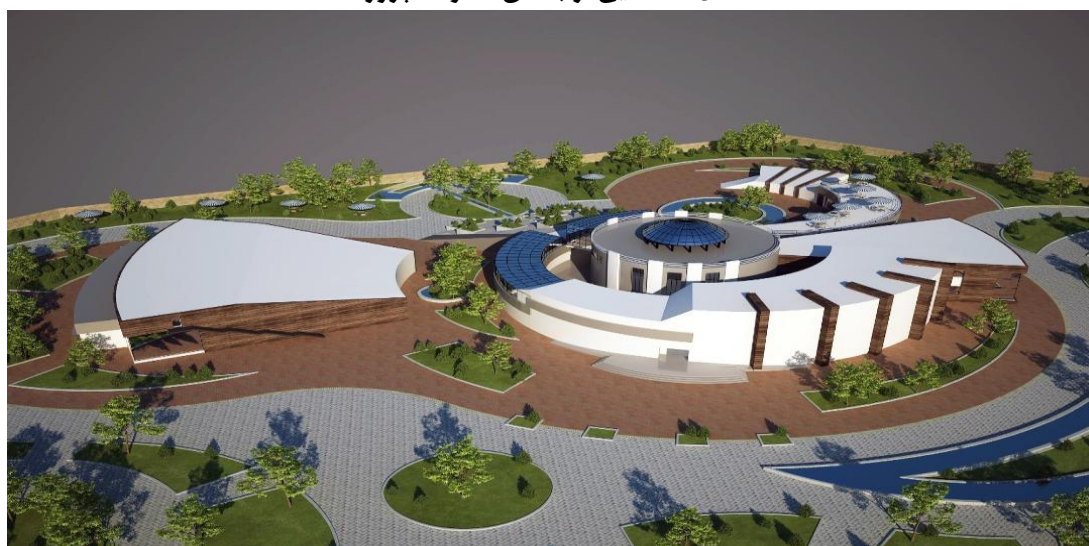
شکل ۶- نمایی از ساختمان اصلی پروژه