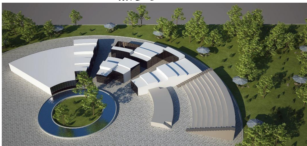
شکل ۵- نمایی از بخش محوطه پروژه