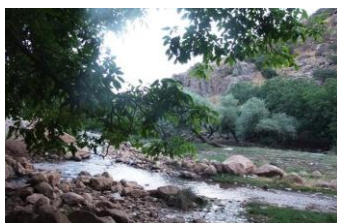
شکل ۶: کرانه رودخانه کاکا رضا

باغات روستا: تمامی زمین های کشاورزی اطراف روستا باغات میوه ای سرسبزی (سیب- گلابی- آلو- گردو) هستند که زیبایی خاص به این روستا بخشیده است. (حبیبی، فاتح، محمدی، ۱۳۹۶).