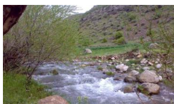
شکل ۲: چشمه تخت شاه

این چشمه در شمال دره ی کهمان قرار دارد و به همراه سراب خاصو قسمت عمده ای از آب رودخانه کهمان را تامین می کند.