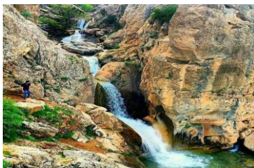
شکل ۷: آبشار ورتختان