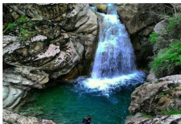
شکل ۱: آبشار دروازه