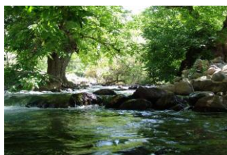
شکل ۵: رودخانه کهمان

سرچشمه رودخانه کهمان، چشمه تخت شاه و چشمه های اطراف آن می باشد که پس از جاری شدن در دره ی کهمان آب چشمه سراب خاصو و دیگر چشمه های دیگر به آن پیوسته و رودخانه کهمان را تشکیل می دهد، این رودخانه زیستگاه ماهی قزل آلائی رنگین کمان نیز می باشد، در کنار این رودخانه درختان کهنسال گردو و بید وحشی رشد کرده و سایه ساری بهشت گونه را به وجود آورده اند. در بعضی روستاهای شهرستان الشتر، خروش رودخانه به حدی است که امکان عبور از آن امکان ندارد. (حبیبی، فاتح، محمدی، ۱۳۹۶).