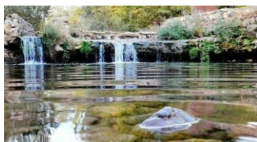
شکل ۳: چشمه سراب خاص

خاص در زبان لکی یعنی خوب و خاصو جمع خوبان می باشد. این چشمه در قسمت شرقی دره کهمان قرار دارد. این چشمه از نوع چشمه های گسلی و دارای فراوان در زیر سایه سار درختان گردوی چند صد ساله کهمان قرار گرفته است.