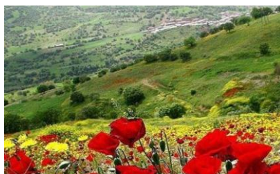
شکل ۸: سراب گلپهو

وجه تسمیه گلپهو به معنی مکان گل های خوب است. این منطقه سیاحتی در شمال شرق روستای کاکا رضا و در دامنه کوه زرین مشتمل قرار گرفته و دارای دو سراب دائمی و یک سراب فصلی است. در کنار سراب های گلپهو، وجود دو درخت کهنسال چنار و در کنار آن سیاه چادر عشایر در فصول بهار و تابستان بر جذابیت هر چه بیشتر منطقه افزوده است (حبیبی، فاتح، محمدی، ۱۳۹۶).