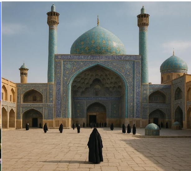
مسجد شیخ لطف الله