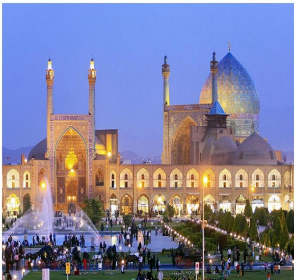
مسجد امام (عباسی)