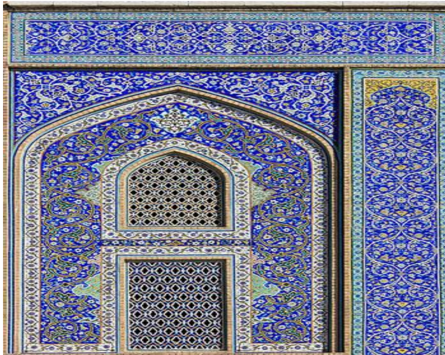
شکل ۹. کاشی کاری مسجد شیخ لطف‌الله