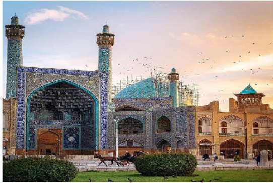
فضاهای عمومی اطراف مسجد امام (عباسی)