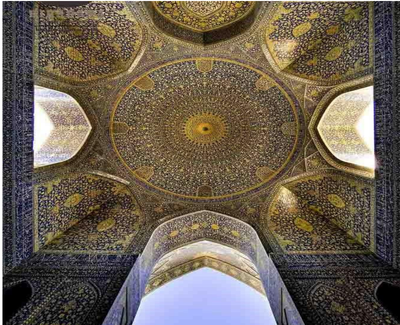
شکل ۶. گنبد مسجد شیخ لطف الله، منبع: کتاب مساجد در تمدن اسلامی