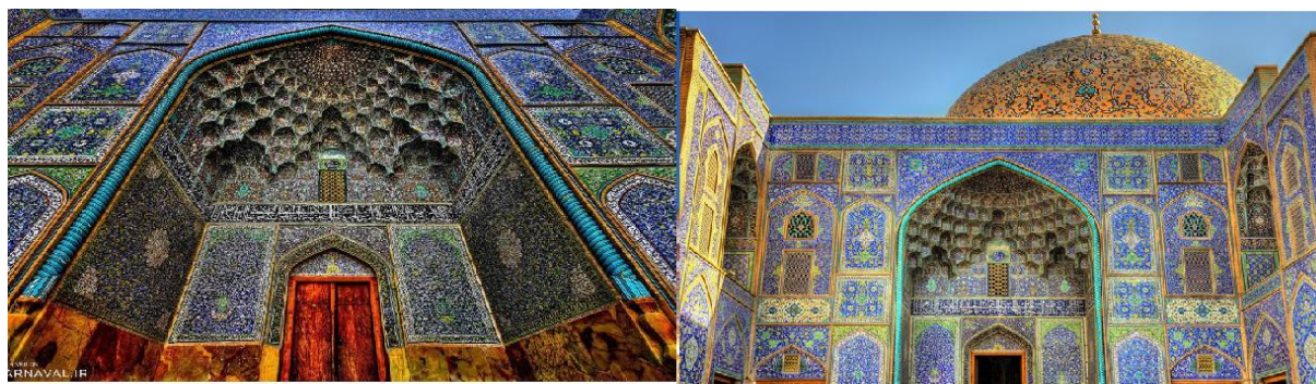
مسجد امام با نقوش تزئینی

یکی از مهم‌ترین راه‌های این بازنمایی، ساخت فضاهای مذهبی با معماری متمایز بود. مساجد جامع، مدارس دینی، مقابر امام‌زادگان و حسینیه‌ها با ویژگی‌هایی همچون گنبدهای فیروزه‌ای، مناره‌های بلند، کتیبه‌های خطی با مضامین شیعی و نقوش هندسی و اسلیمی شکل گرفتند. در این بناها، نام دوازده امام، به‌ویژه امام علی و امام حسین، بارها تکرار می‌شود و این بازتابی از ارادت رسمی به اهل بیت است. علاوه بر آن، معماری مذهبی در شهرهایی مانند اصفهان، مشهد، قم و کاشان به‌گونه‌ای سامان‌دهی شد که مراکز شیعی را به‌عنوان نقاط محوری هویتی برجسته کند. مثلاً ساخت مسجد امام و مدرسه چهارباغ در اصفهان، افزون بر کارکرد مذهبی، پیامی سیاسی-ایدئولوژیک داشت. این فضاها محل تجمع علما، طلاب و مردم بودند و در عین حال وحدت مذهبی و وفاداری به حکومت صفوی را تقویت می‌کردند.