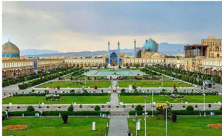
گسترش فضای شهری در کنار مکانهای مذهبی