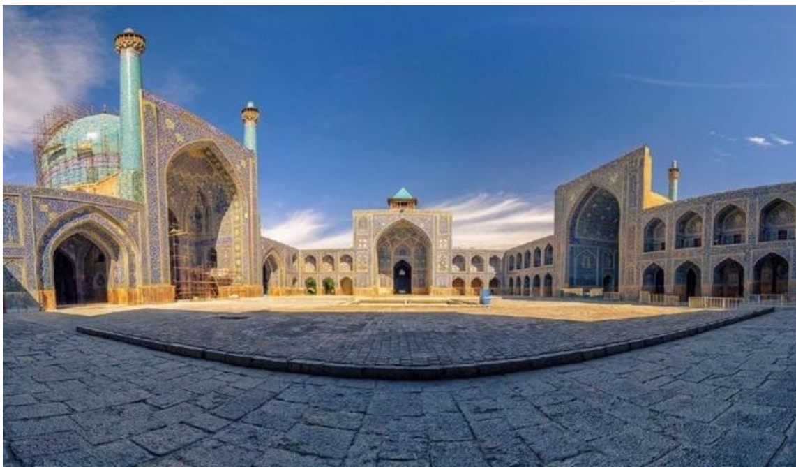
شکل ۷. حیاط مسجد جامع اصفهان

حیاط‌های بزرگ و باز در مساجد صفوی همچنین به‌عنوان مکانی برای برگزاری مراسم‌های مذهبی و اجتماعی عمل می‌کردند. برای مثال، در مساجد بزرگ مانند مسجد جامع عباسی و مسجد امام اصفهان، حیاط‌های مرکزی با حوض‌های بزرگ طراحی شده‌اند که علاوه بر کاربرد طهارت و وضو، به‌عنوان نمادی از پاکی و بهشت نیز تلقی می‌شوند. این فضاهای باز، ارتباط میان معماری و طبیعت را نیز تقویت می‌کردند و به مردم امکان می‌دادند تا ضمن انجام عبادات، ارتباط خود را با طبیعت حفظ کنند.