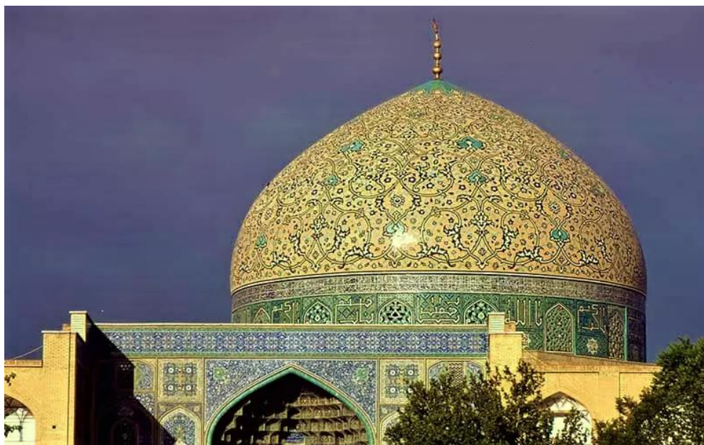
شکل ۸. نمای بیرونی گنبد مسجد شیخ لطف‌الله

یکی از مهم‌ترین ویژگی‌های معماری صفوی، استفاده از گنبدهای دوپوسته در ساخت مساجد و اماکن مذهبی است. این گنبدها که به‌ویژه در مساجدی مانند مسجد جامع عباسی و مسجد شیخ لطف‌الله دیده می‌شوند، نه تنها از نظر ساختاری پیچیده و هنرمندانه هستند، بلکه از نظر معنوی نیز حائز اهمیت‌اند. در تفکر شیعی، گنبد نمادی از آسمان و عالم معنوی است و گنبدهای دوپوسته با دو لایه متفاوت از یکدیگر، بیانگر پیوند میان عالم مادی و معنوی هستند پوسته داخلی گنبد که معمولاً با تزیینات نفیس و کاشی‌کاری‌های دقیق مزین شده است، نمادی از عالم باطنی و معنوی است، در حالی که پوسته خارجی گنبد با شکوه و عظمت خود، نمادی از قدرت خداوند و شکوه مذهب شیعه است. این گنبدها از نظر مهندسی نیز یکی از شاهکارهای معماری صفوی به شمار می‌روند، زیرا علاوه بر زیبایی ظاهری، از نظر ساختاری بسیار مقاوم و پیچیده هستند. گنبدهای دوپوسته با وجود طراحی پیچیده، به‌گونه‌ای ساخته شده‌اند که بتوانند نیروهای وارد بر ساختمان را به‌طور یکنواخت توزیع کنند و استحکام بنا را حفظ کنند