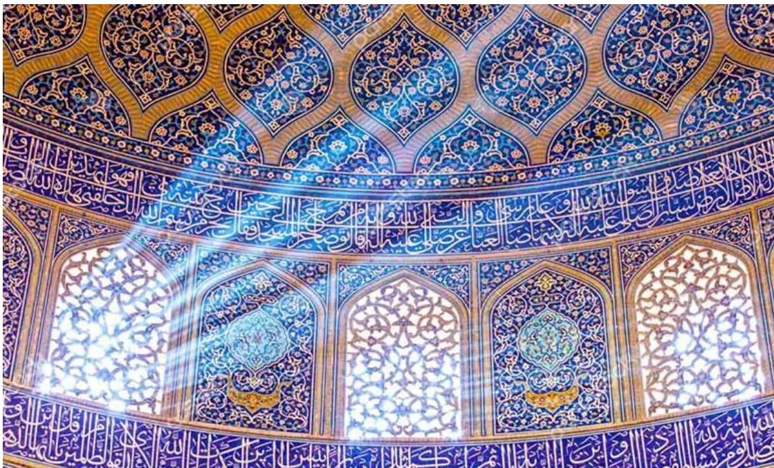
شکل ۱۰. بازی زیبای نور در مسجد شیخ لطف‌الله، منبع کتاب مساجد در تمدن اسلامی

نور در معماری صفوی به‌ویژه در بخش‌های مهمی مانند محراب، گنبد و شبستان‌ها حضوری نمادین داشت. این نور که به‌طور دقیق و هوشمندانه به داخل ساختمان هدایت می‌شد، نمادی از حضور الهی و تجلی نور حقیقت در جهان مادی بود. معماران صفوی با استفاده از بازی نور و سایه، فضایی معنوی و روحانی در مساجد خود ایجاد کردند که نمازگزاران را به تأمل و تفکر در معنویت دین دعوت می‌کرد.