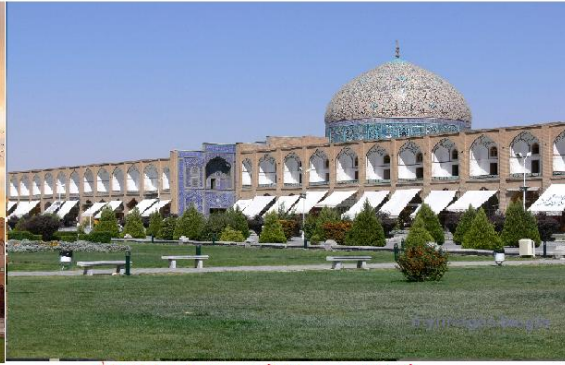
فضاهای عمومی اطراف مسجد شیخ لطف الله