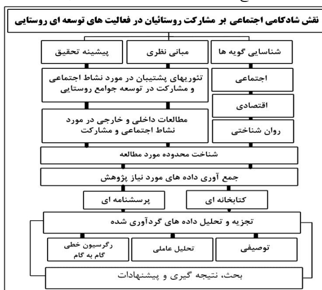
شکل ۲: مدل اجرایی پژوهش

به طور کلی مراحل انجام تحقیق در این پژوهش مشتمل بر ۶ مرحله می‌باشد که با طراحی موضوع شروع شده و پس از تدوین مبانی نظری، گویه‌های مرتبط بانشاط اجتماعی و مشارکت روستائیان انتخاب شده و در نهایت داده‌های مورد نیاز از طریق منابع کتابخانه‌ای و توزیع پرسشنامه در محدوده مورد مطالعه گردآوری شده است و در نهایت در محیط spss اقدام به تجزیه و تحلیل داده با استفاده از آزمون‌های آماری تحلیل عاملی و رگرسیون گام‌به‌گام شده است و در نهایت نیز با توجه به نتایج به دست آمده از داده‌های پرسشنامه و همچنین ویژگی‌های اجتماعی، اقتصادی و محیطی منطقه پیشنهادهایی در جهت رفع مشکلات ارائه گردیده است. (شکل ۱)