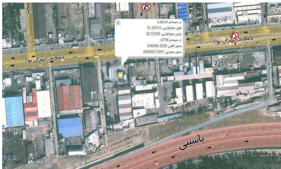
شکل ۵- جایگاه اتوگاز دماوند

جایگاه دوم: دماوند؛ تهران - چهارراه تهرانپارس - خ. دماوند - جاده آبعلی - روبروی ماشین‌سازی پارس