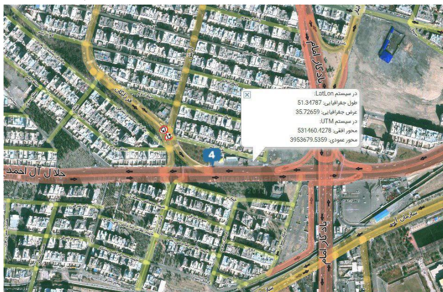
شکل ۶- جایگاه اتوگاز جلال آل احمد منبع: نگارندگان

جایگاه سوم: جلال آل احمد؛ تهران - بزرگراه جلال آل احمد - بعد از پل یادگار امام