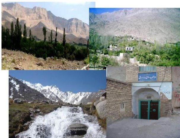
شکل ۲- جاذبه‌های گردشگری مجموعه روستایی ده بالا