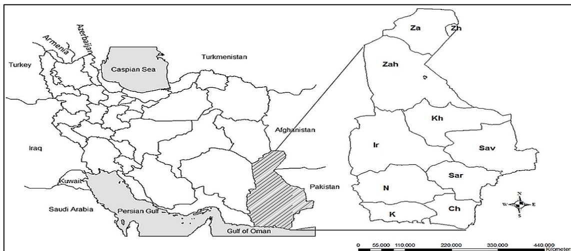
نقشه شماره ۳- موقعیت استان سیستان و بلوچستان

استان سیستان و بلوچستان با وسعتی معادل ۱۸۷ هزار کیلومترمربع به عنوان پهناورترین استان کشور از نظر پیشرفت و توسعه در شرایط خوبی نیست. علیرغم تلاش دولت‌های مختلف در طی سی و پنج سال گذشته، سیستان و بلوچستان به عنوان یکی از محروم‌ترین استان‌های کشور مطرح است. رتبه‌ی اول بیکاری، رتبه‌ی اول بی‌سوادی، رتبه‌ی اول زایمان‌های غیربهداشتی (زایمان در منزل)، رتبه‌ی اول بیماری‌های ایدز و سل، وجود بیش از پانصد هزار نفر تحت پوشش نهادهای حمایتی از جمله کمیته‌ی امداد و بهزیستی تنها گوشه‌ای از عقب‌ماندگی‌های استان است. در این شرایط به نظر می‌رسد که اگر قرار است که در مورد تقسیم استان تصمیم‌گیری شود شایسته است مبنای این تصمیم‌گیری توسعه‌ی استان باشد. باید به این نکته توجه داشت که عقب‌ماندگی استان محصول عواملی است از جمله: محرومیت تاریخی به جای مانده از بی‌توجهی حکومت پهلوی، دوری راه به نحوی که هزینه‌ی پروژه‌های عمرانی را بسیار بالا می‌برد، طولانی شدن فرآیند اجرای پروژه‌ها که در مواردی به چهار تا پنج برابر زمان پیش بینی شده می‌رسد، سیستم بودجه دهی دولت اگر چه مکانیزمی علمی است اما با توجه به موارد پیش گفته برای رسیدن استان به متوسط نورم‌های توسعه در کشور کفایت نمی‌کند و با این روند هرگز استان به متوسط نورم‌های توسعه‌ی کشور نمی‌رسد، نظام اداری تبیل و پرگیر و گرفت اداری و فرآیند طولانی صدور و مجوزها و موافقت‌نامه‌ها و عدم نظارت لازم و کافی، مهاجرت نخبگان و تحصیل کردگان و مدیریت‌های ناکارآمد هم از دیگر عوامل عقب‌ماندگی استان است (شهرکی و سردار شهرکی، ۱۳۹۳: ۱۳).